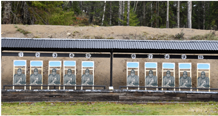
Station 1: 1 fast målgrupp, 2 figurer, STÅ 45, 8 sekunder, poängräkning i S20.