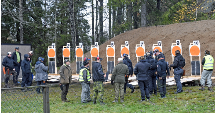
Stat. 4: 1 målgr., 2 figurer, Sittande, 16 sekunder.