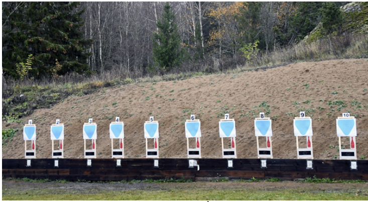
Stat. 7:1 målgr., 3 figurer, STÅ U 45, 7 sekunder.