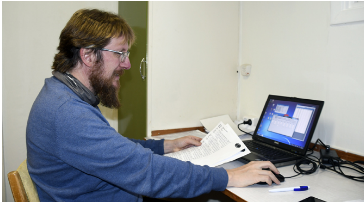
Resultaten knappas in!

De tre bästa resultaten av fyra deltävlingar räknas ihop för att få fram totalsegrarna!