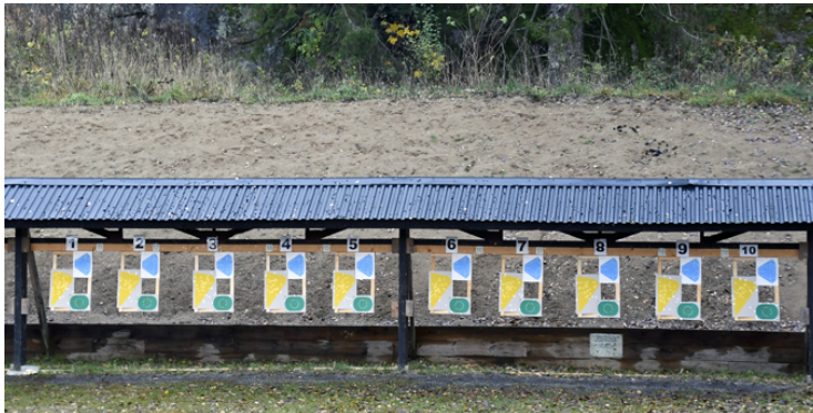
Stat. 5: 1 målgr., 3 figurer, STÅ U, 9 sekunder.