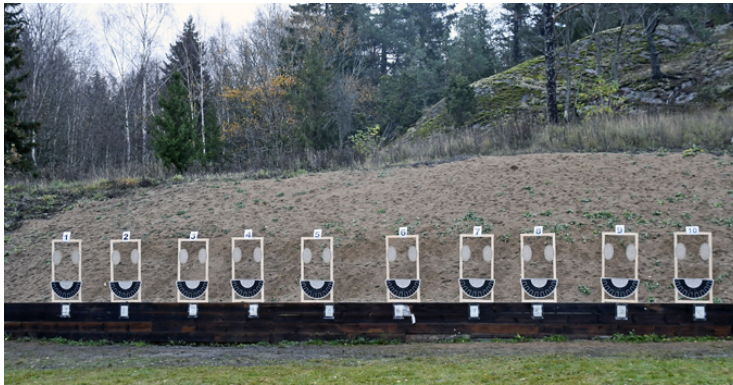
Stat. 8: 1 målgr., 3 figurer, STÅ 45, 8 sekunder, poäng i bägge ovaler.