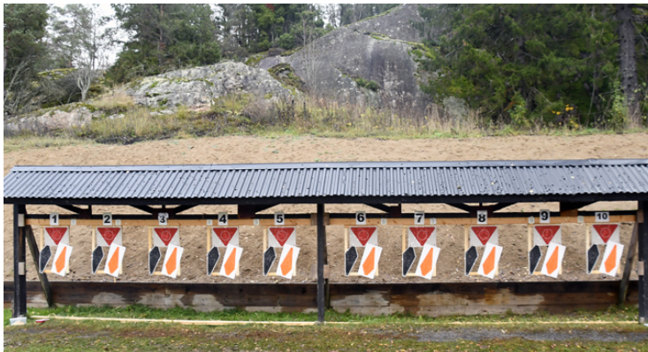
Stat. 6: 1 målgr., 3 figurer, STÅ 45, 10 sekunder.