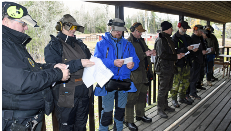
Upprop på klubbhusets veranda.

Tack för visat intresse, och ha en god avslutning på detta året nu.