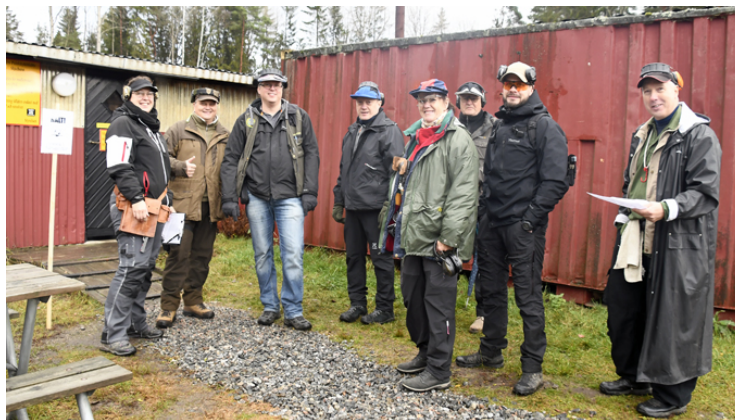
Förväntansfull & glad patrull väntar på insläpp vid station 11