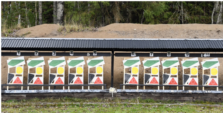
Stat. 2: 1 fast målgrupp, 4 figurer, STÅ U, 11 sekunder.