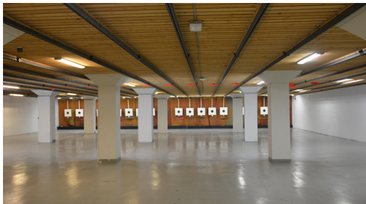
Ljus och fräsch skjuthall på "The Target" i Västberga.