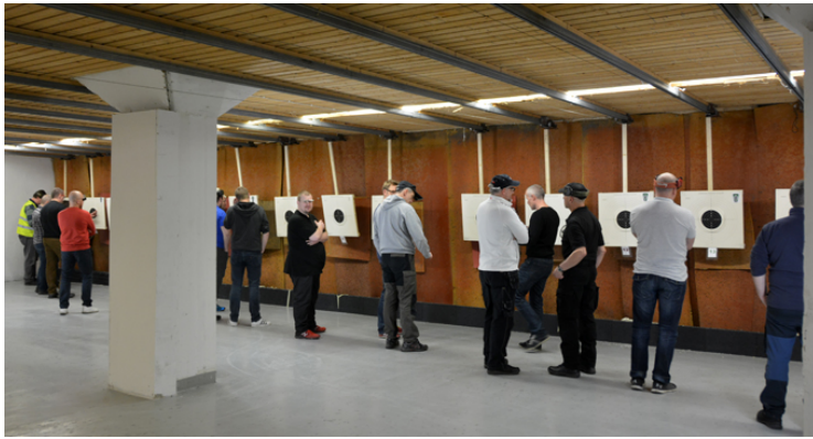
Få 50-poängare i år, men en hel del 49-or!