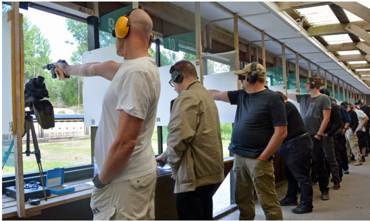
Fokusera! Strunt i att du rör dig lite i riktnområdet och krama försiktigt tills det smäller