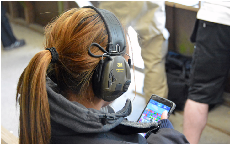
... kunde se resultaten direkt på Gripens hemsida!