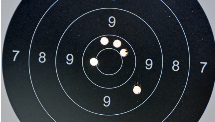
Ingen tolkning behövdes här!