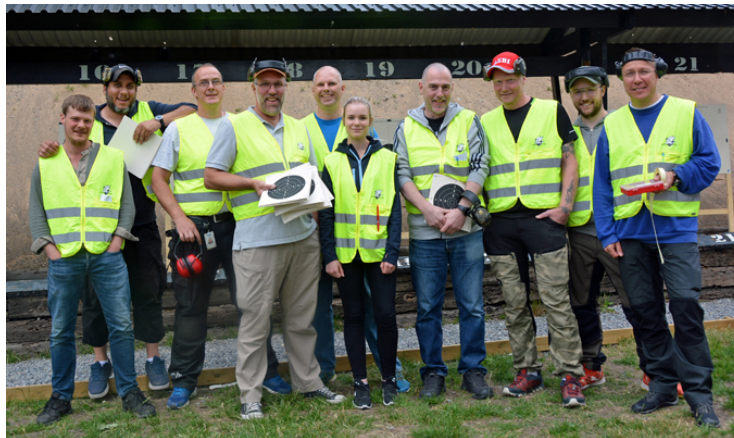
En del av funktionärerna som hjälpte till att göra TORRBOLLEN en succé!