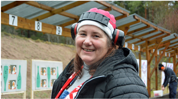
Tomtemor i Rosersberg hade koll på det mesta!