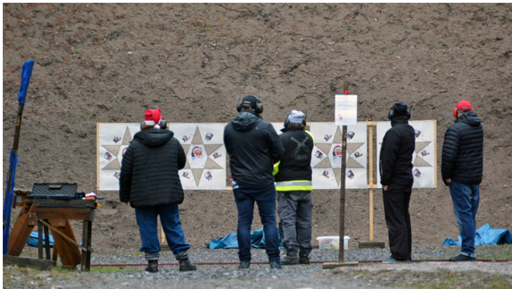
AJ,AJ, AJ, stackars tomten blev träffat!