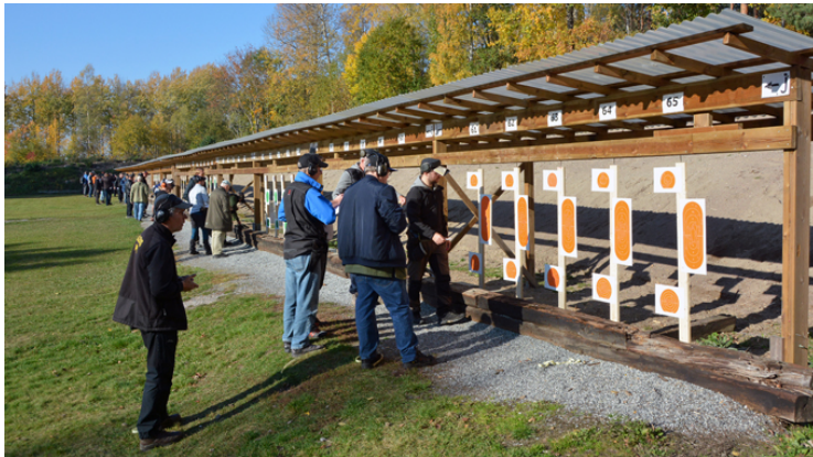
Gemensam markering på de 6 första stationerna!