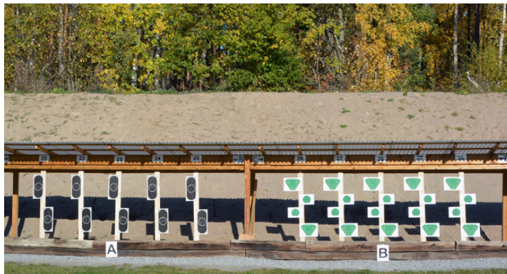
Station 4. 2 målgr, 6 figurer, Stå utan, fram bort. A |—7—| 3 |—6—| B |—7—| 3 |—6—|