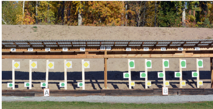
Station 3: 2 målgr, 5 figurer, Stående, fram- och bortsvingande. Poäng i C20. A |—2—| |—3—| |—2—| B |—7—| |—6—|