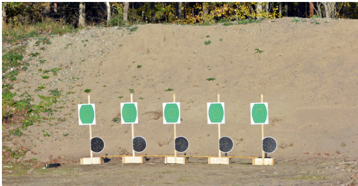
Station 8: 1 målgr, 2 fasta figurer, Stå utan 45, 16 sekunder.