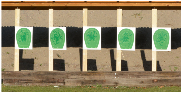
Station 5: 1 målgr, 1 fast figur, Stå utan 45. Fort ska det gå! 8 sekunder!