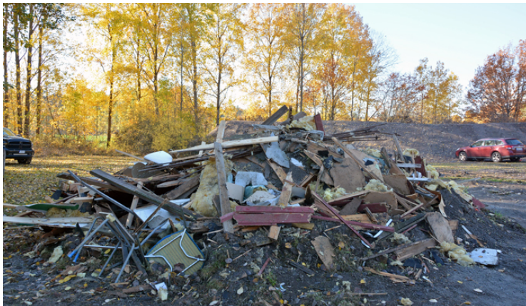
Sedan gick man till 50-meters banan och såg "allt som var kvar av fripistolhallen!"