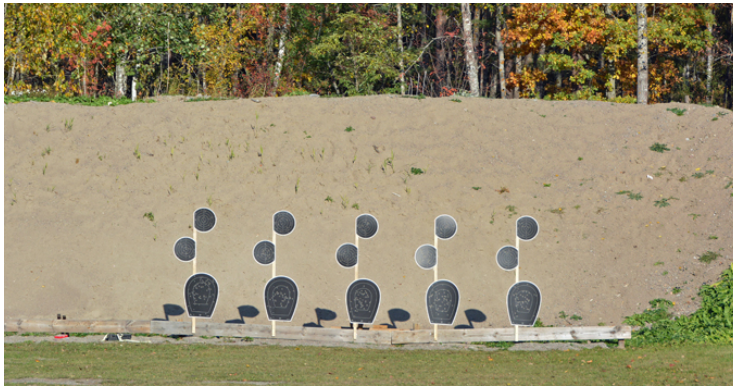
Station 7: 1 målgr, 3 figurer, Stå 45, 16 sekunder, särskiljning i båda C35.