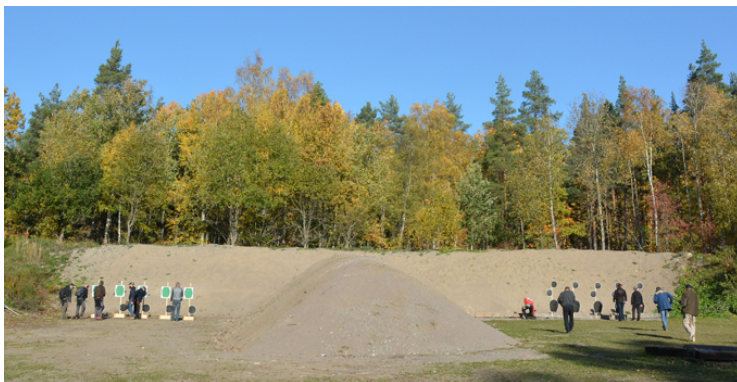
Nytt för i år var också den nya vällen mellan station 7 och 8 på f.d. fripistolbanan.