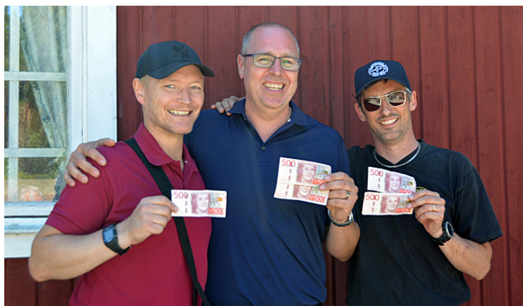
Tre ATLAS-skyttar "rånade" Upplands Väsby på 2500 kronor!