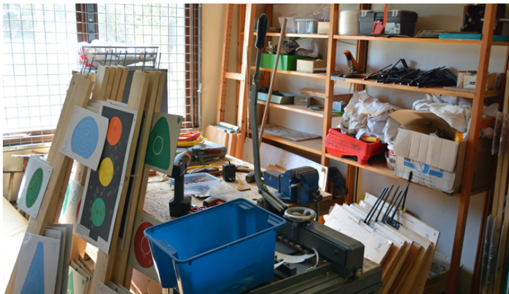
... och egen verkstad. Kan det bli bättre? Knappast!