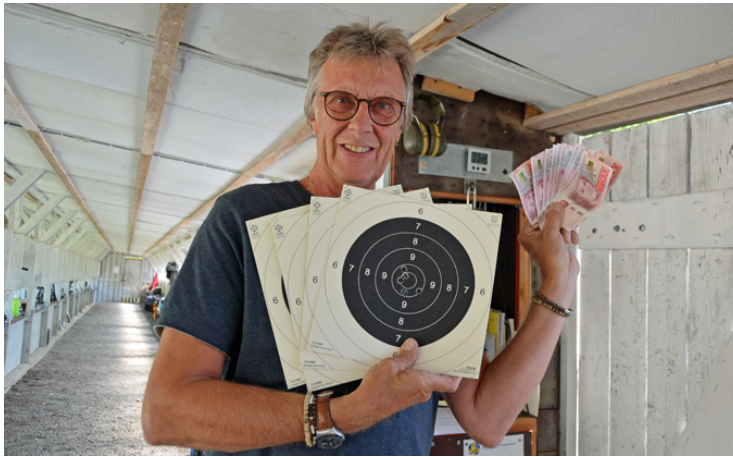
Elva (11) gånger 500 blev det till slut, men när allt var över så var det "ändå lite pengar" kvar!