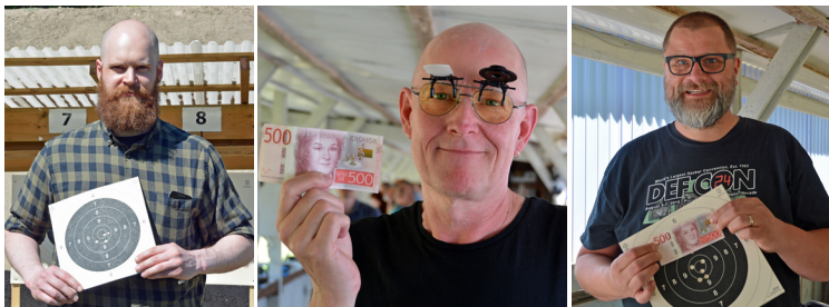
Flera lyckliga (och nu något rikare) skyttar!