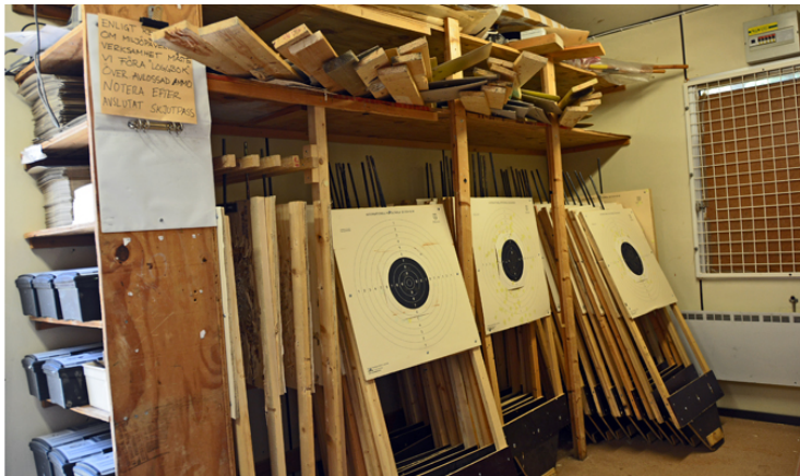
Upplands Väsby, en välbärgad klubb med stor skjutbana, rymlig klubbstuga, samt stort förråd . . .