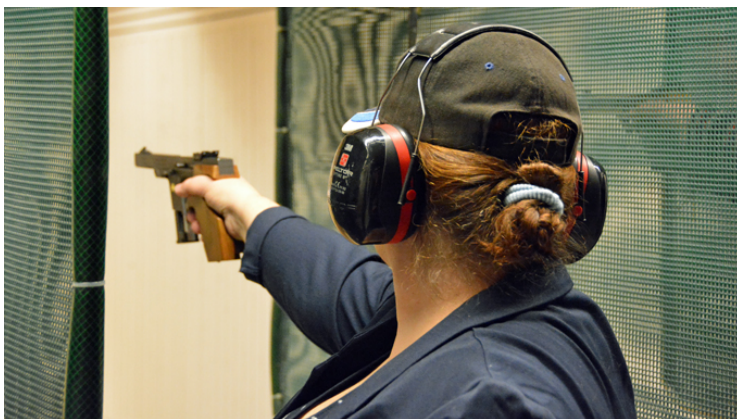
Även Kickle "sköt skarpt"!