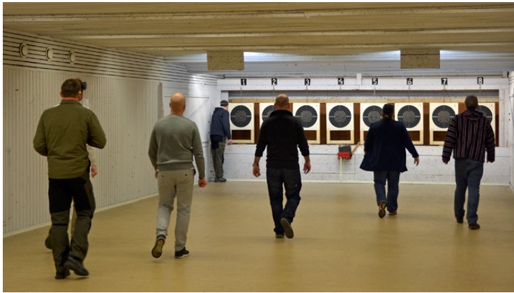
Vad blev det den här gången?