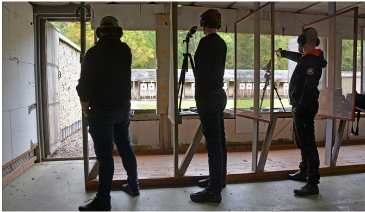
"Hur svårt kan det vara att träffa TIAN?"