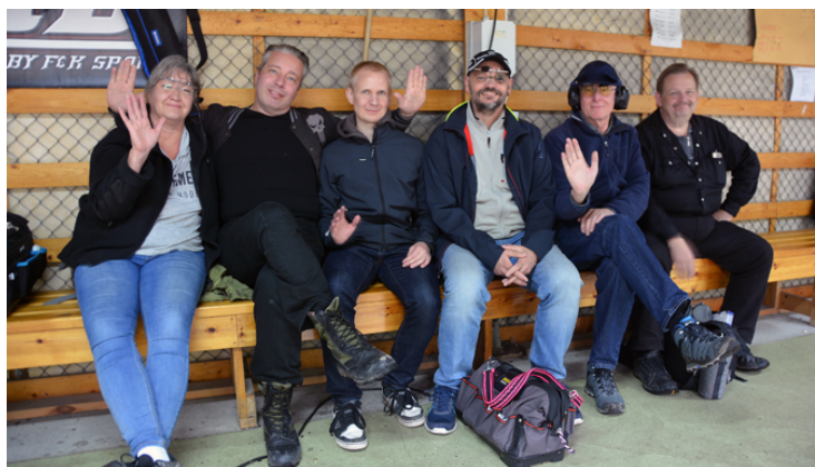
Handens glada och duktiga pistolkyttar är alltid med på Mälärskottet. Vår och höst!