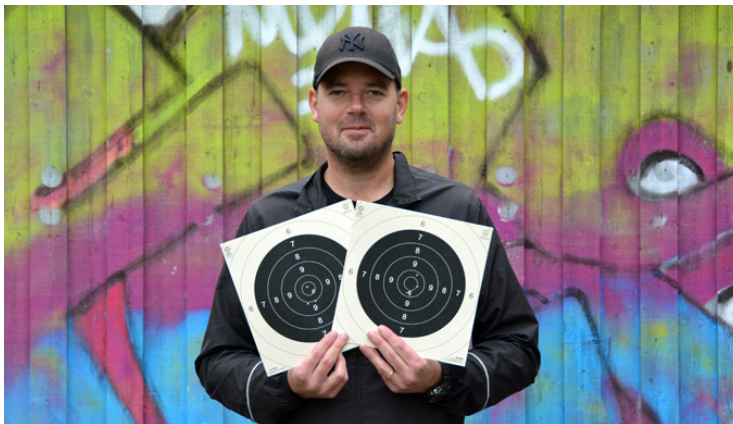
"Är man bäst så är man!"