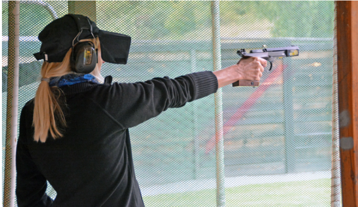
"Törnrosa in action"