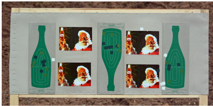
Motiven på fyran ...