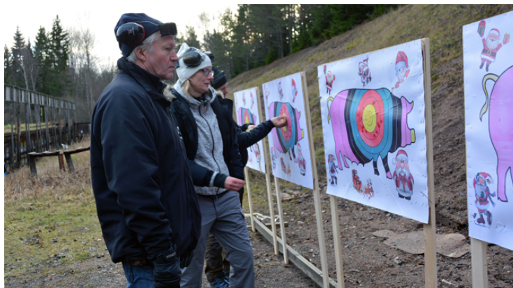
WOW! ALLT I GULT!