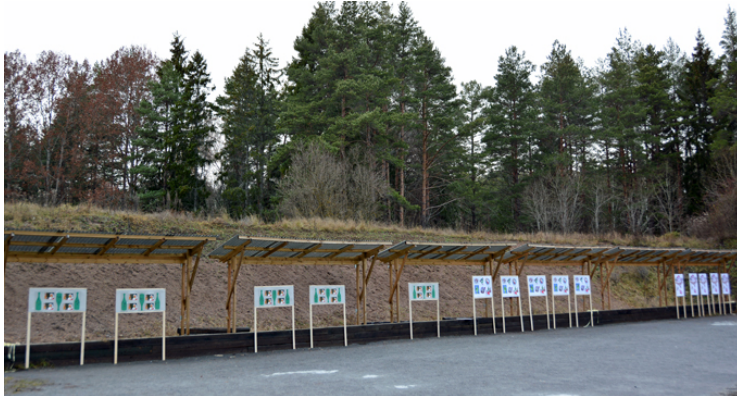
Station 2 + 3 + 4 på den fina och breda skjutbanan.