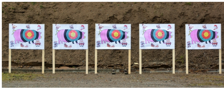
Nu skulle man tydligen skjuta höga poäng också! I det GULA!