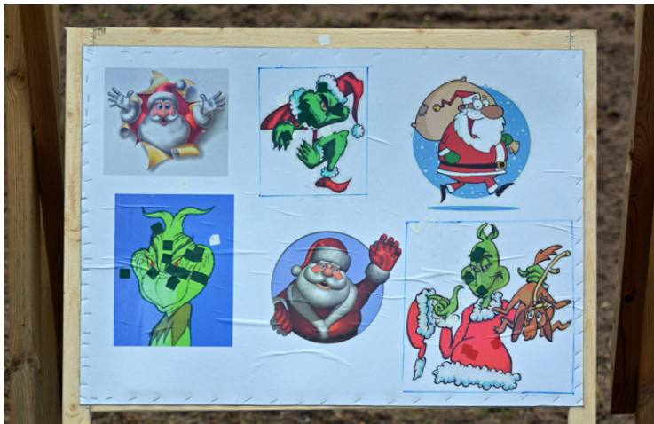
Motiven på station 3! Skjut INTE på julmoten!