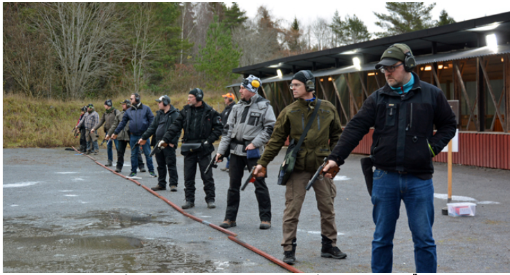
Skyttarna på station 2, 3 och 4 sköt samtidigt på 15 sekunder. FÄRDIGAI