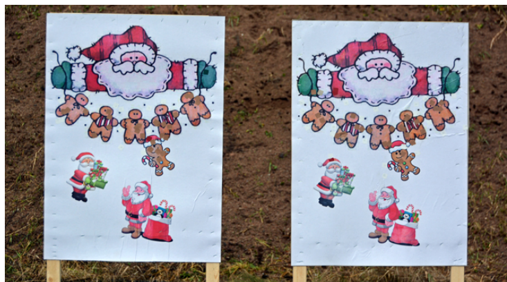
Station 2: ALLA pepparkakor ska träffas! Men det var inte det lättaste!