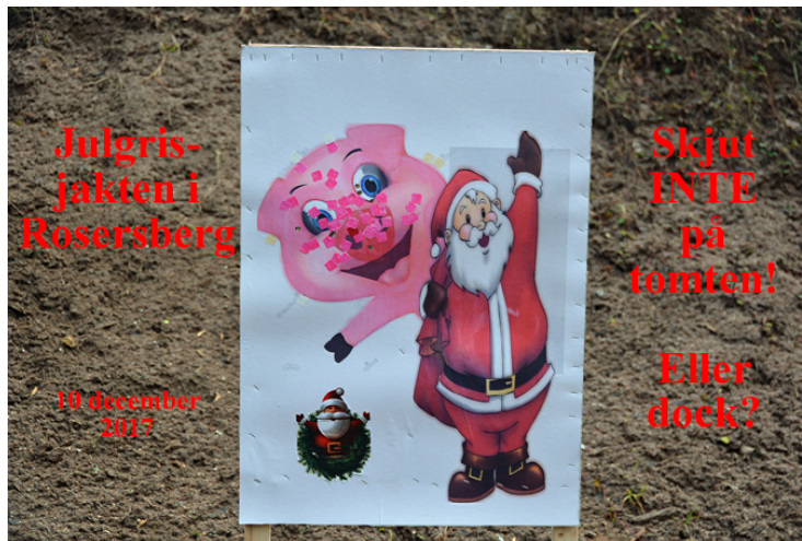
Station 1: Skjut i trynet, det ger mest poäng!