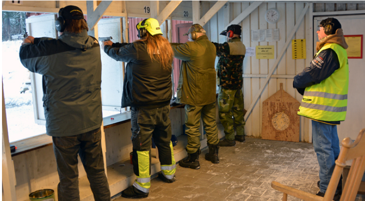
"ELD" - när tavlorna vänder fram.