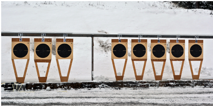
Station 3 + 4: Två serier Militär Snabbmatch på 10 och 8 sekunder. (Grov 14 och 12)