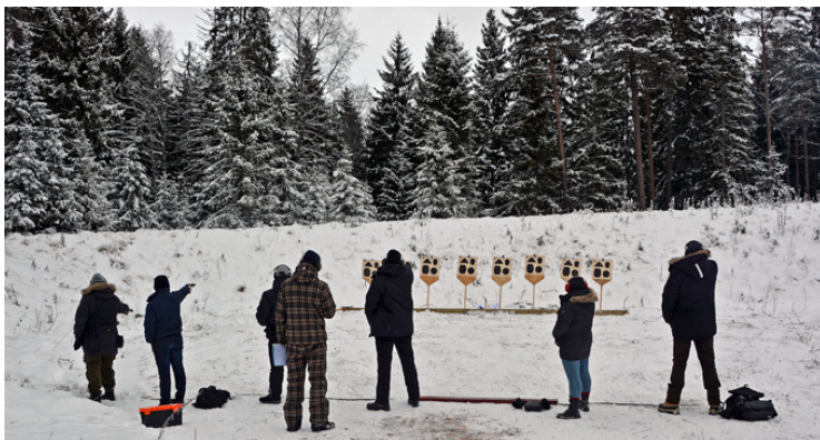
Station 5 + 6: Helmatchtavlan med fyra små "fältmål" FIN: 12 och 15 sekunder. GROV: 15 och 18 sekunder.