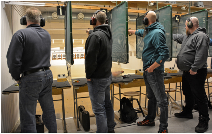
Tavlorna vänder - lyft snabbt, sikta i mitten och krama Inom 3 sekunder!