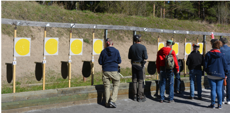
Station 3: A: framme de första och sista 2 sek, B: 10 sek emellan, direktväxlande, poäng i A.