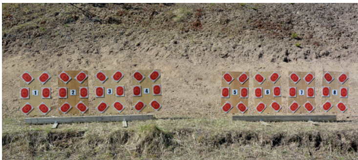
Station 6: 6 fasta mål på vällen, Stå utan 45, en i varje, 14 sekunder.