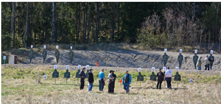
Station 8: Långhåll i motljus! A- & B-mål fast, Stå 45, 18 sekunder.