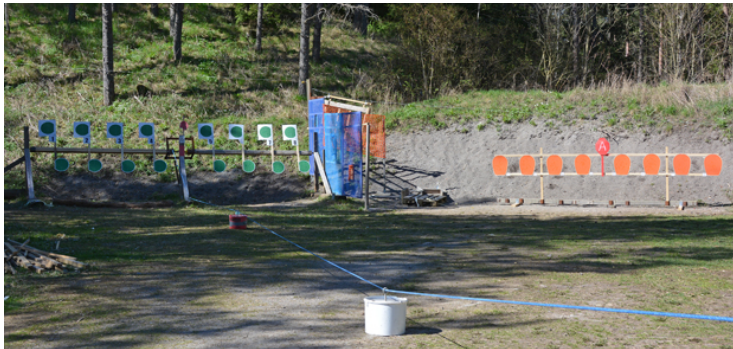
Station 4: A: fast, B: vippbom 4 sista sekunder, Stå 45, totalt 14 sekunder, poäng i B-målet.