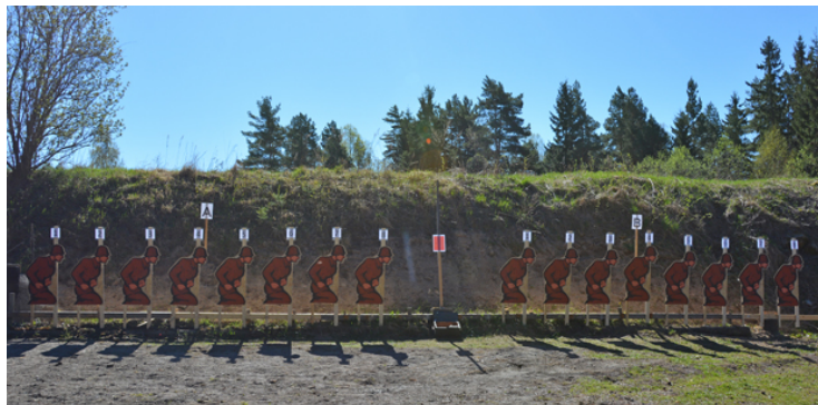
Station 1: A- och B-mål, fast, 15 sek, St. utan 45.

Som så många gånger förr arrangerade Rosersberg Pk en omtyckt och lyckad GROVFÄLTSKJUTNING! Synd bara att det tar ett helt år till nästa gång!