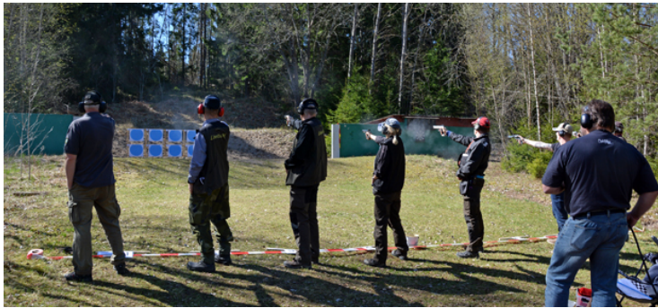
< vänster > höger < vänster . Se filmen!