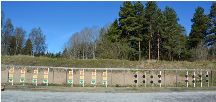
Station 2: Stående, A: de första och sista 2 sek av skjuttiden, B: 14 fast, poäng i A.