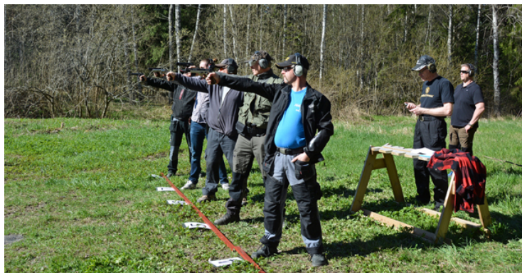
EEELD på första station.