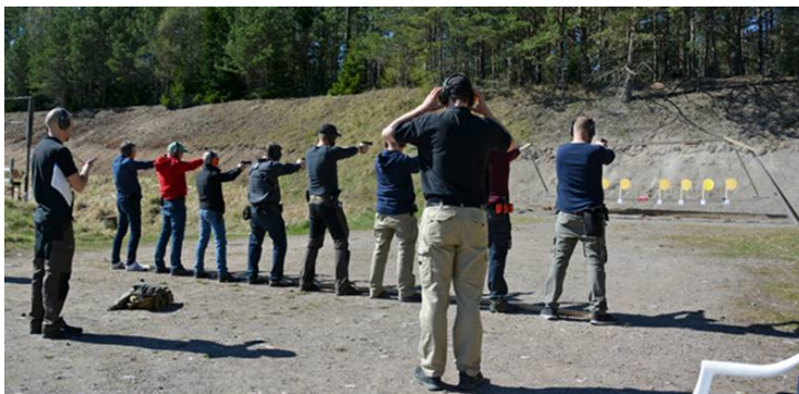
Station 5: GUNGAN, Stå 45, 18 sek, poängräkning.