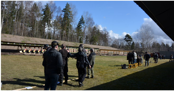
Gemensam markering underlättade och sparade tid!