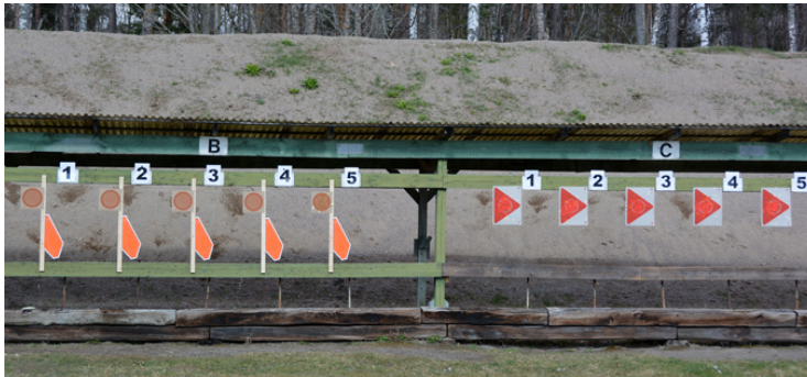
Station 3: Sittande, 3 fasta figurer, A- och B-mål.