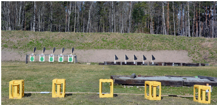
Station 7: Sittande, A- och B-mål.