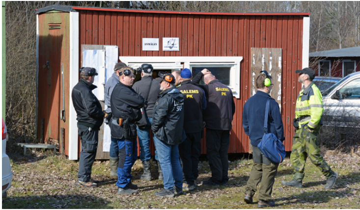
Först vapenkontroll och sedan anmälde man sig ...