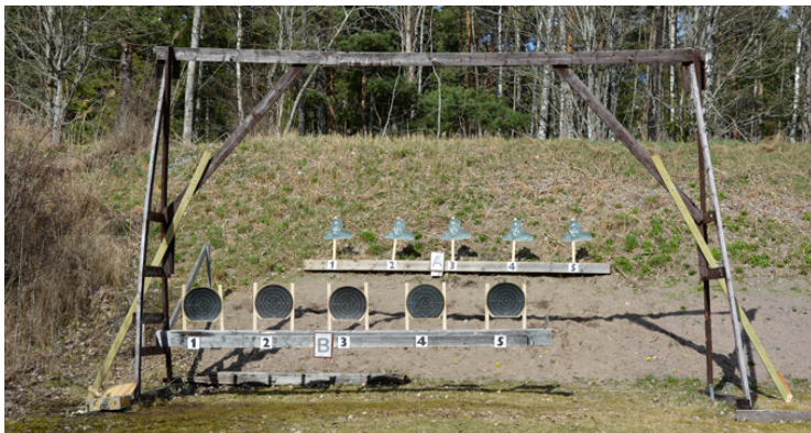
Station 8: Gungan 14 sekunder, poängräkning. Klicka här för att se filmen!