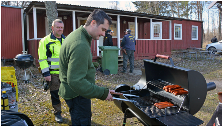
Eggebygrillen med sina kryddiga korvar.