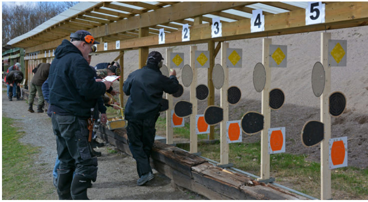
Station 5: 5 figurer, 4 + 3 + 4 med 2 sekunder emellan.