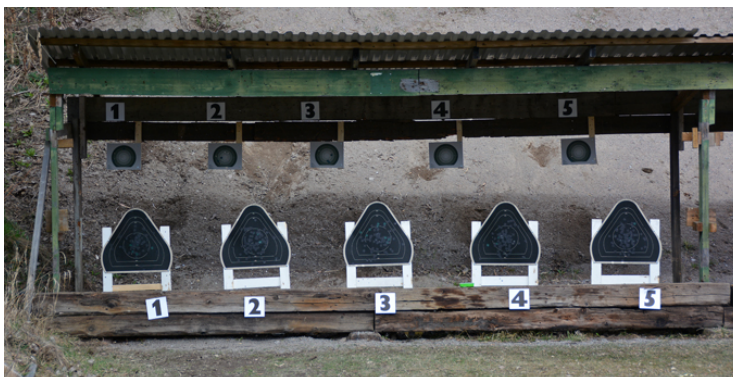
Station 1: 2 figurer, poängräkning i den övre C20.