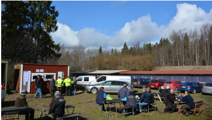
Efter skjutningen: Korv & läsk, kaffe & kakor och en titt på resultatlistan.