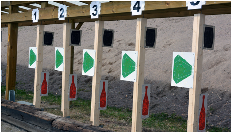
Station 6: 3 figurer direktväxlande