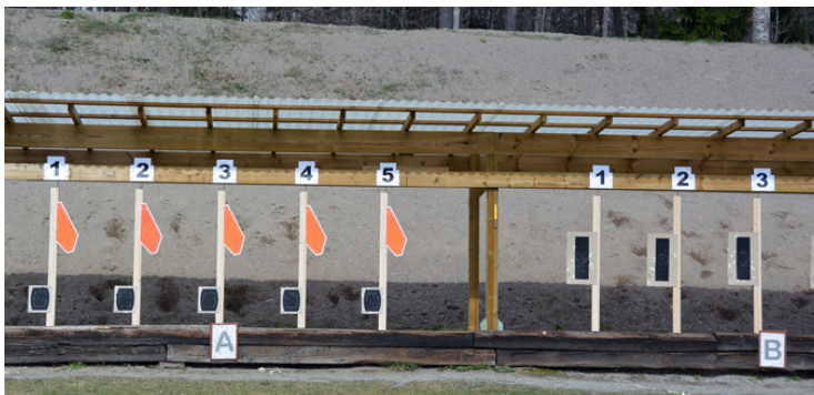
Station 4: 5 figurer > direktväxlande > 2 figurer till fanns bakom bunkerspringan.