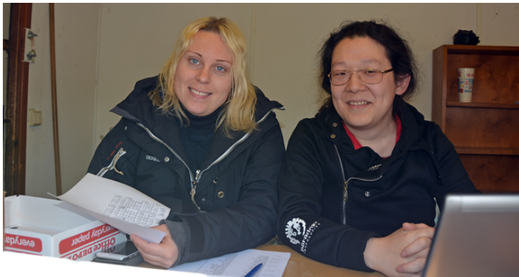
... hos dessa trevliga och kompetenta damer.