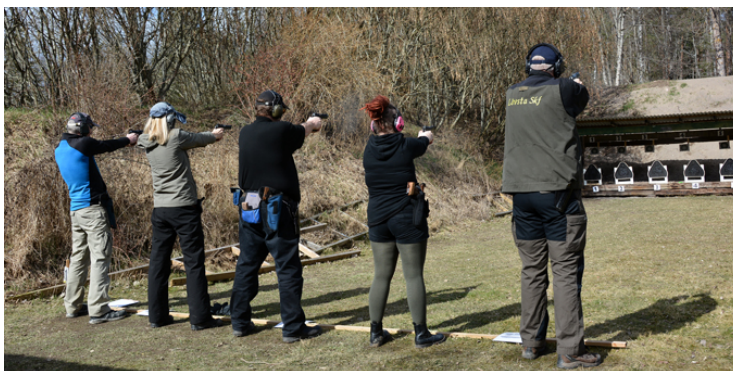
10 sekunder kvar!