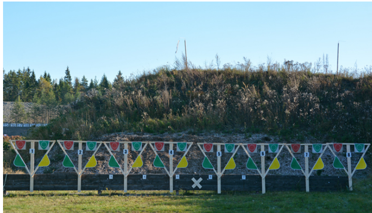
Station 8: Kors och tvärs!