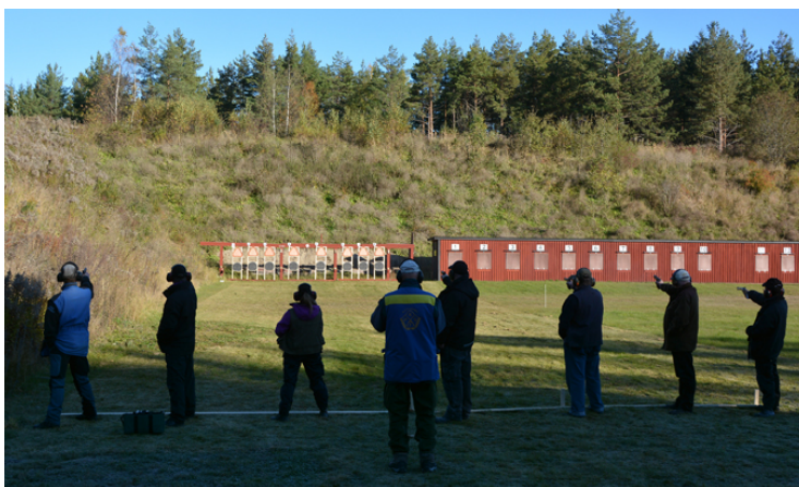
Tävlingen kan börja!