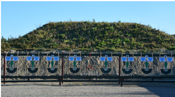
Station 6: Leende ansikten.