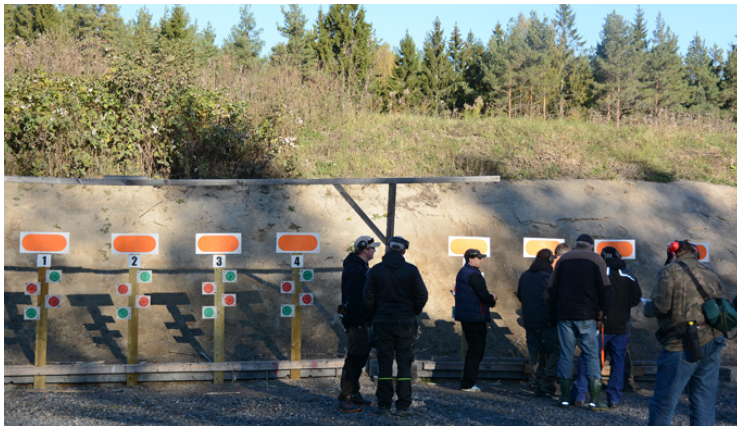
Station 5: Poängmål överst och 4 små snusdosor nertill.

All the way from the US, Gary E Nelson, in action.