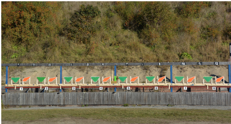
Station 2: Sittande