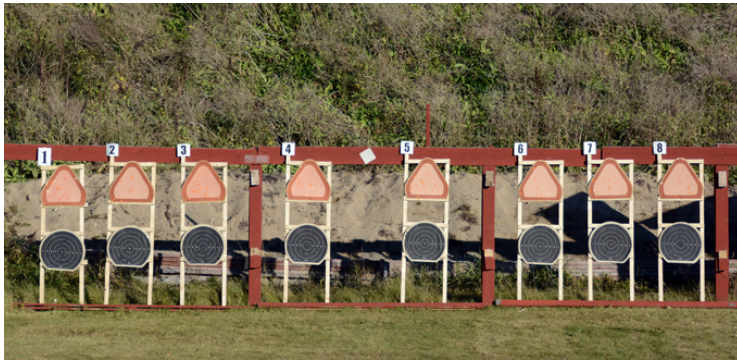
Station 1: Poängräkning i C-målet