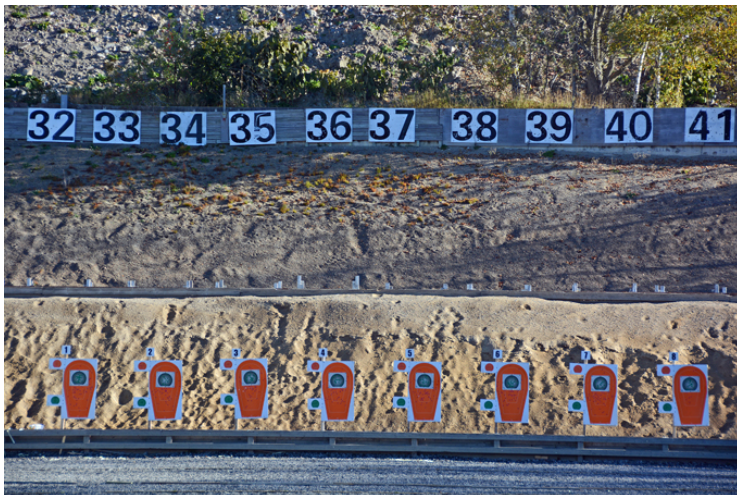
Station 3: Stående