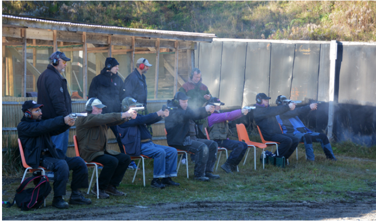
"Relaxed and layed back" på station 2.