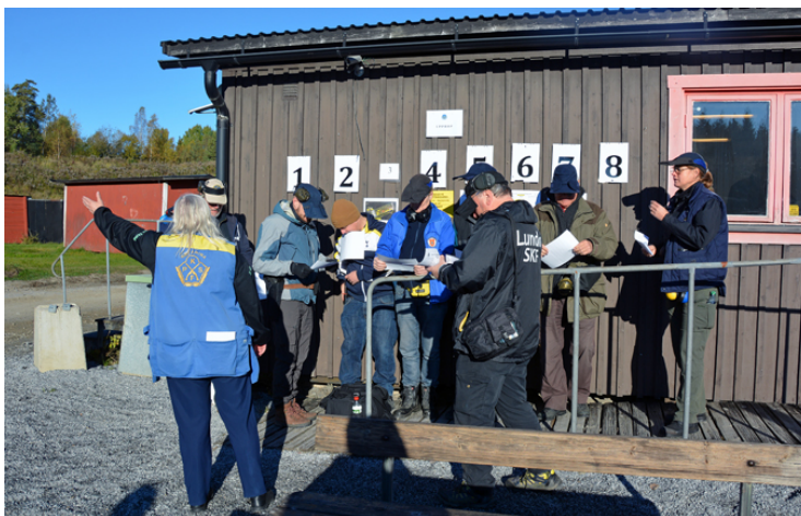
- DÅÅÅ ligger station 11 LYCKA TILL!

Ett STORT GRATIS till KATARINATRÄFFENS VINNARE och "Better luck next time" till andra!