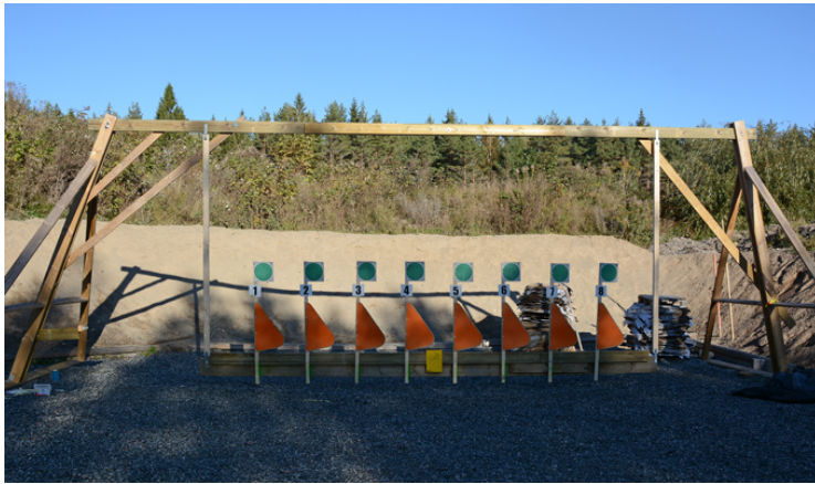
Station 4: GUNGAN var lite knepigt!