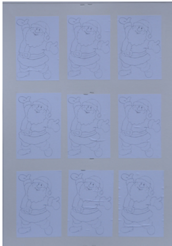
Station 3: "Osynliga" tomtar och dåligaste hand! Max 6!