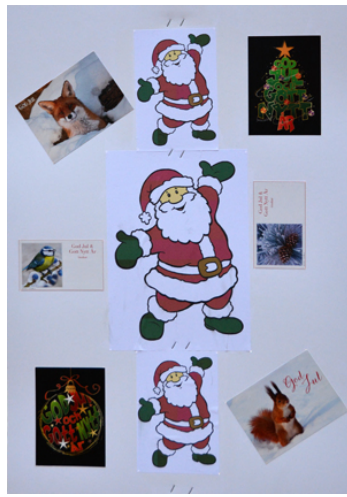
Station 1: Stående 45, 15 sek, max 1.