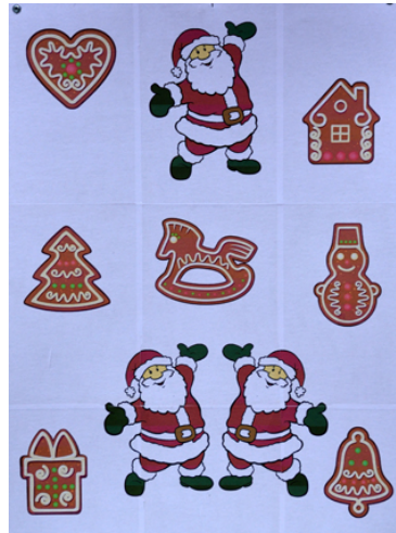
Station 4: Pepparkakor, stå 15 sek, max 1.