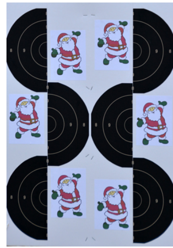
Station 2: Stå utan 45, 15 sek, max 1, poängräkning.