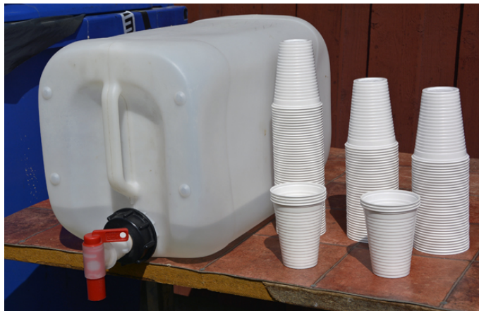
Högsommarvärmel "Vattenhållet" vid station 6 var absolut nödvändigt!