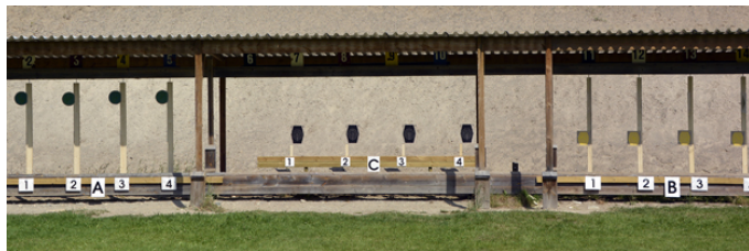
Station 6 - A-mål + C-mål fast