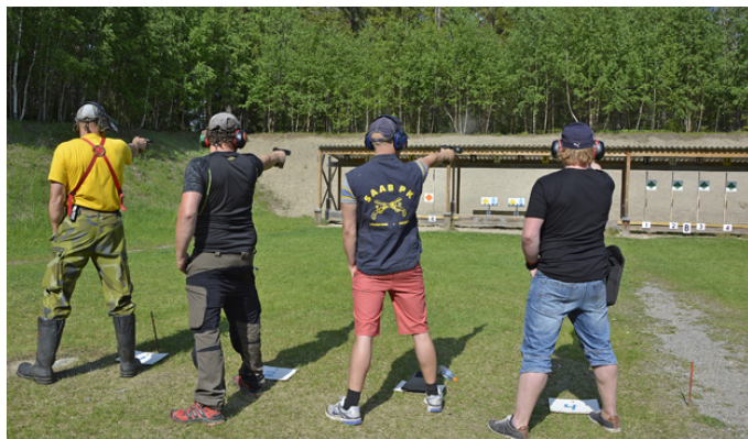
Fyra sköt isär i ÖC och ...