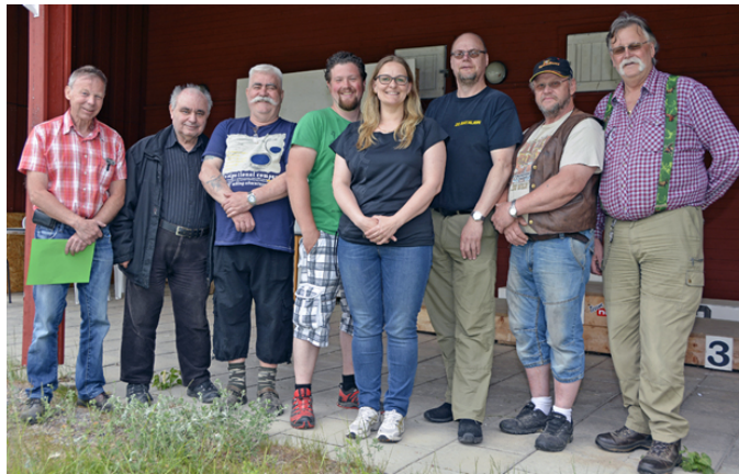
TACK för den HÄR GÅNGEN!