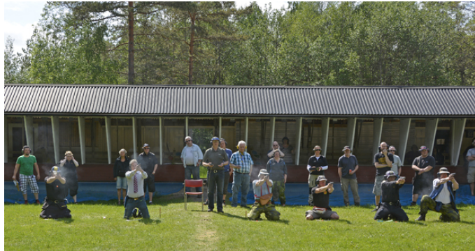
Sex (med 47 träffar) sköt isär i vgrp A på söndag (bland annat knästående), ...