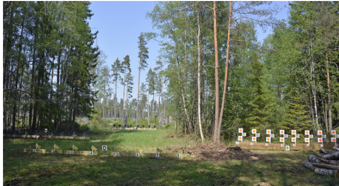
Station 5 - A-, B-, C- och D-mål.