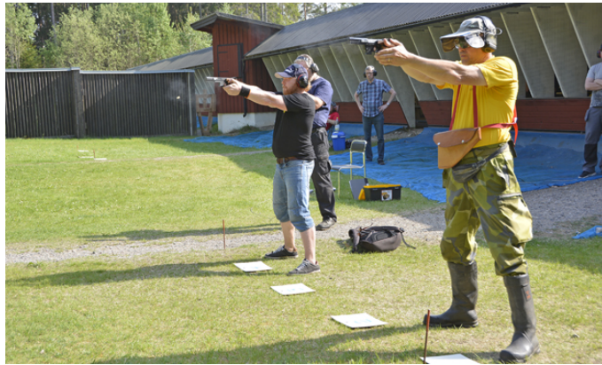
... två var kvar om bronset till slut.