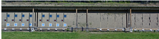
Station 7 - A-mål