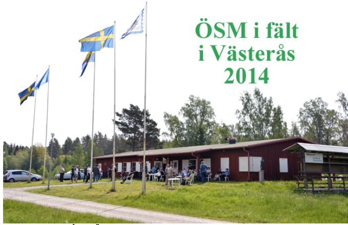
Årets Östsvenska - "het skjutning" i högsommarvärmel