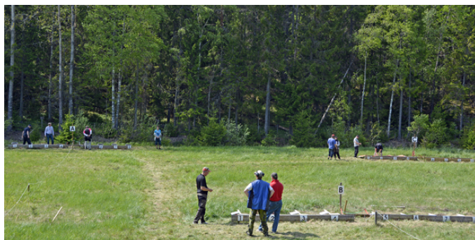
Station 3 - knästående (bara) på lördag.