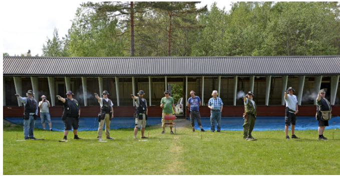
Skjut så det ryker! Söndagens revolverpatruller på station 7.