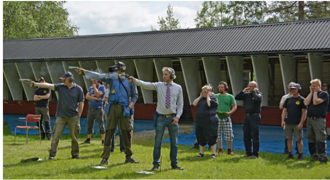
Sju (med 47 träffar) sköt isär i R, tre blev kvar som här skjuter isär om medaljerna.