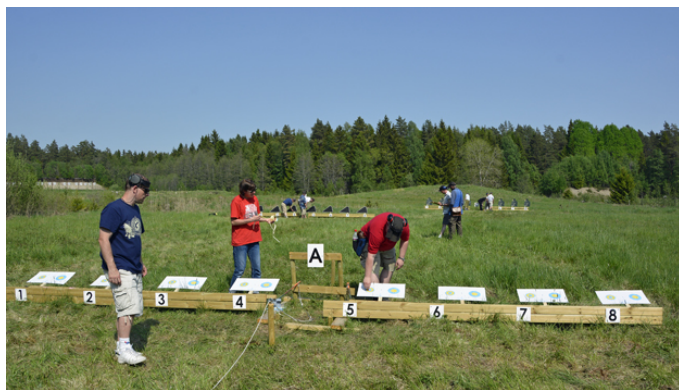
Station 8 - nu är det (nästan) klart! Kanske får man vara med i sarskjutningen?