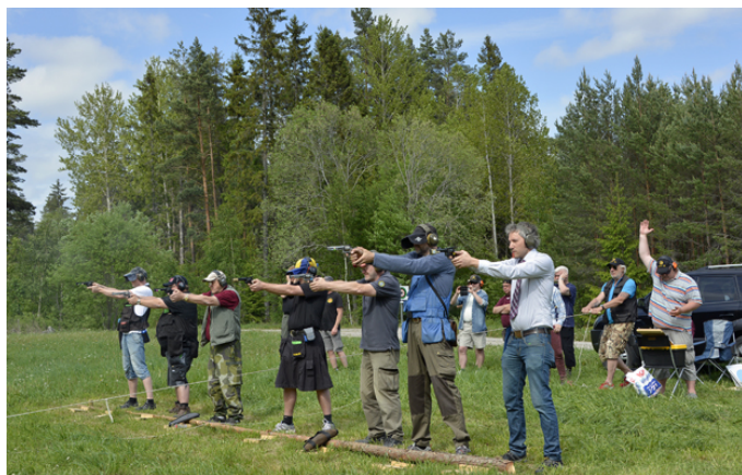
Särskjutning i R på station 1, först stående, ...