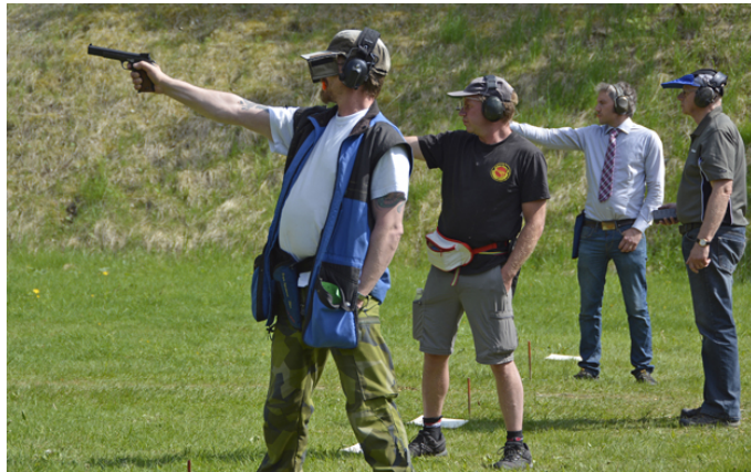
... tills bara tre blev kvar som gjorde upp om medaljerna!