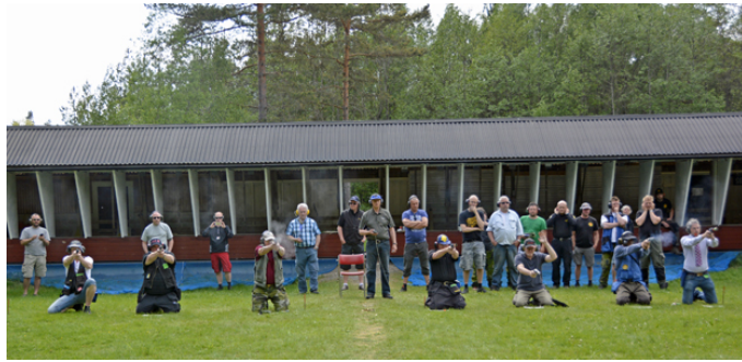
... sedan vidare till station 6 och sist knästående på station 7!