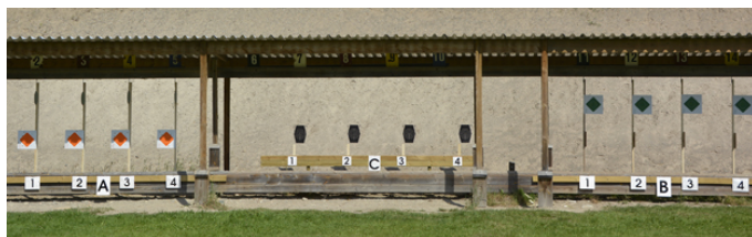
Station 6 - B-mål + C-mål fast