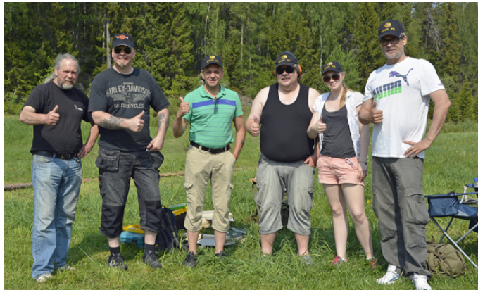
Glada och kompetenta ÖSM-funktionärer på alla stationer!