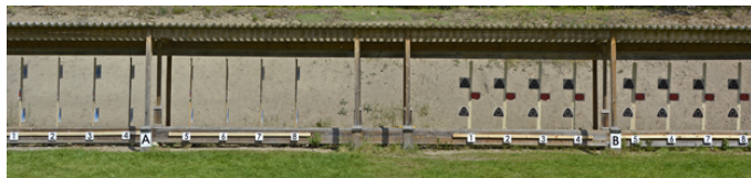
Station 7 - B-mål