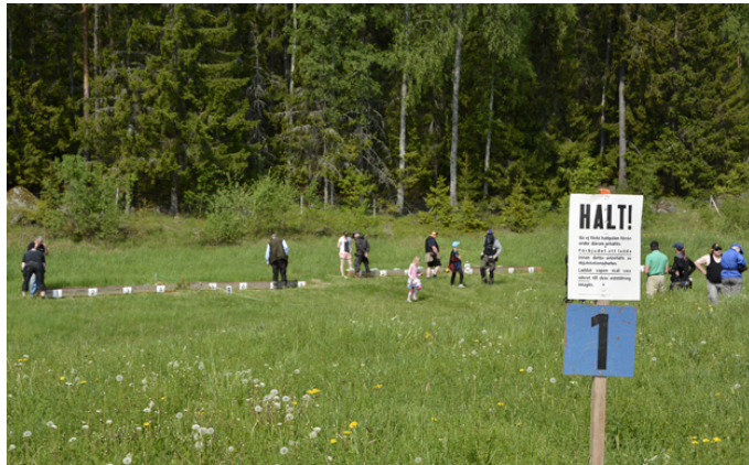
KONCENTRATION! NU börjar Östsvenska Mästerskapen!