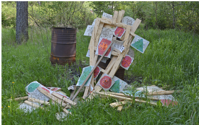
Ännu ett spännande ÖSM är färdigskjutet och nya östsvenska mästare korade!