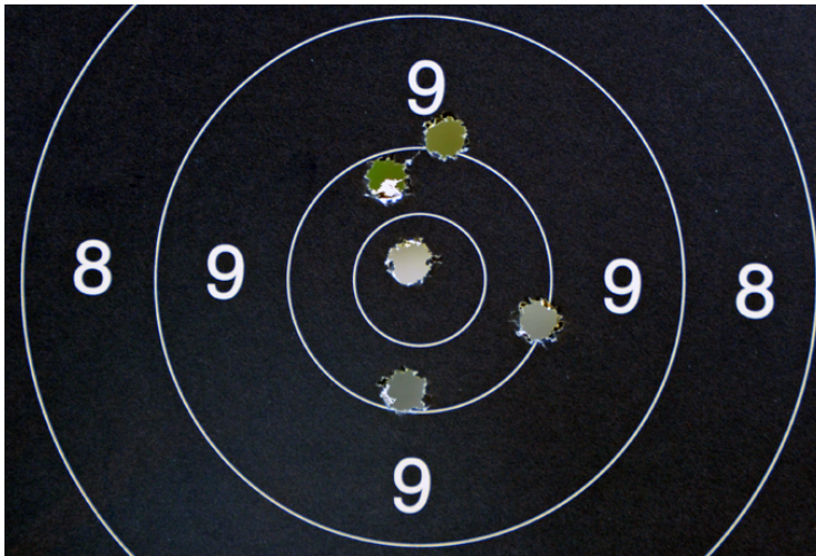
- Så här ska det se ut! Sa Morgan och såg belåten ut!