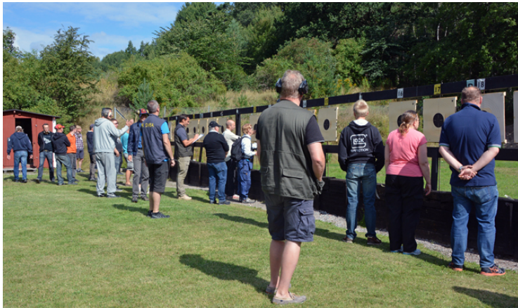
Fullt med skyttar på populära kretsprecisionen på Lövstal