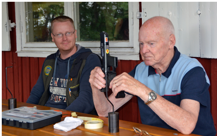
- Förtroende är bra, men kontroll är bäst! Tyckte man i vapenkontrollen.