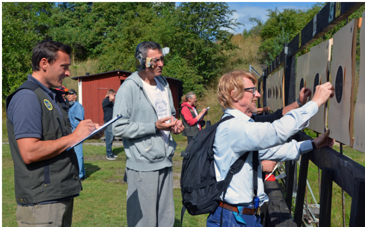
10 10 10 10 10 - WOW! 50!