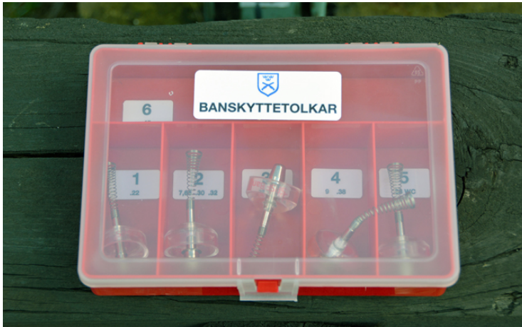
Korrekta, nationella tolkar från SPSF visade rätt valör!