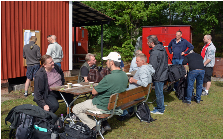
Och som avslutning en kopp kaffe och den berömda "Toast Lövsta"!

Nästa tävling på Lövsta är kretsmästerskapet i Revolver den 5 oktober! VÄLKOMNA IGEN!