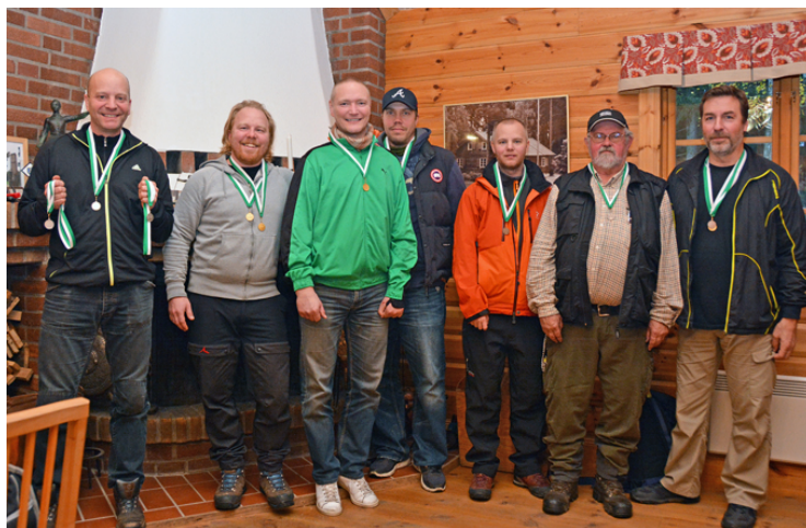
Kretsmästare i lag i ÖC - Atlas Copco Pk silver - Lövsta Skf brons - SAPK