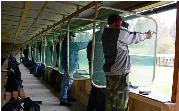
6 sekunder i A och R är tufft - även med stödhand!