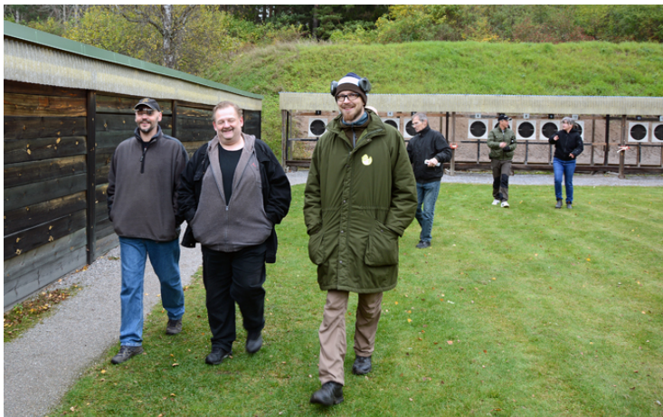
Glada skyttar! Trots regn och rusk och sämre ljusförhållanden.