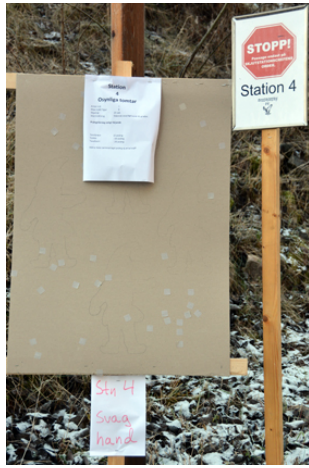
Osynliga tomtar och dåligaste hand!