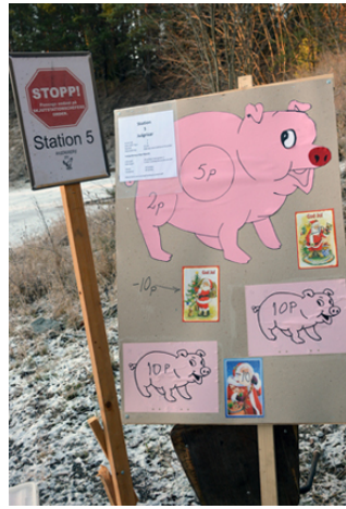
Riktigt grisigt var det på sista station!