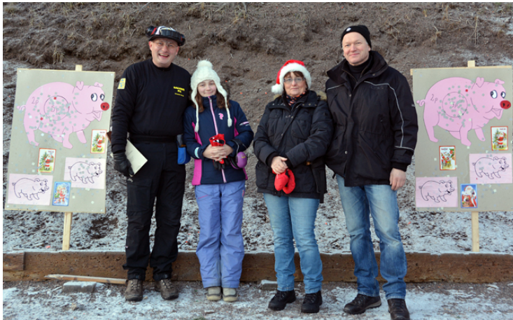
Färdigskjutet! Då går man tillbaka till serveringen och laddar med glögg, julmust, korv, kaffe, pepparkakor och Lussekatter!