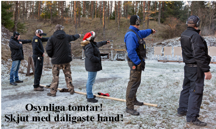
Osynliga tomtar! Skjut med dåligaste hand!