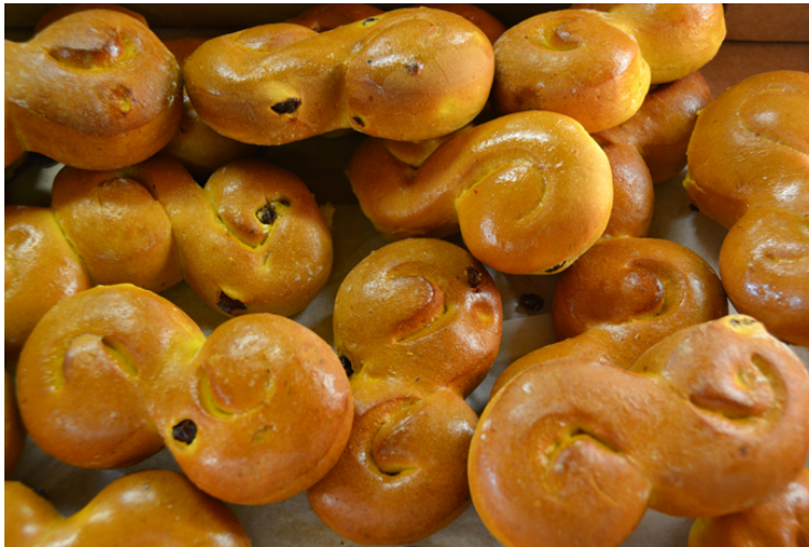
Saffransdoftande härligheter, med mera, i klubbhuset!