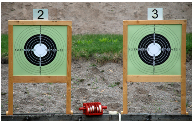
I NOSTALGITÄVLINGEN skjuter man på den "gamla precisionstavlan"!