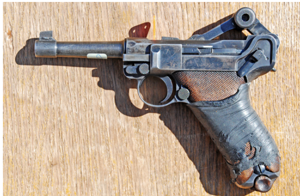
... sin gamla 9 mm Parabellum från 1902!