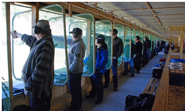
... som förstås var fullsatt som alltid på Majtävingen!