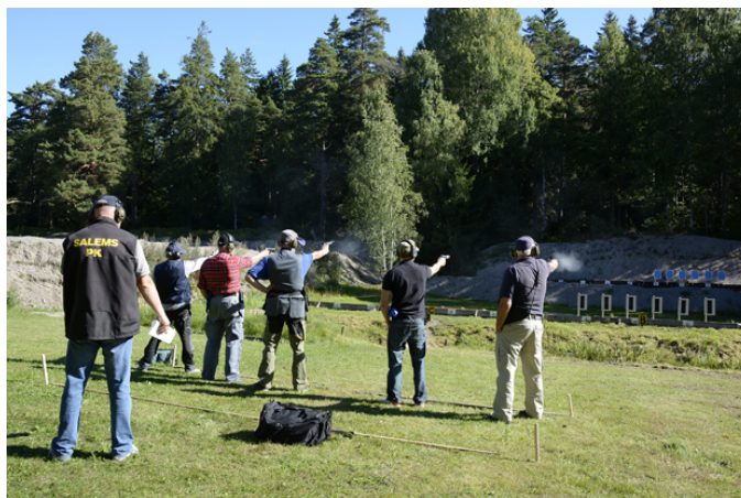
Station 1. St utan 45, A + B fast, C uppdykande de sista 3 av 16 sekunder.