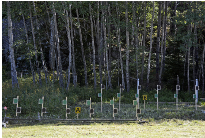
Station 2: Stå, B fast, A uppdykande de första och sista 3 av 12 sekunder.