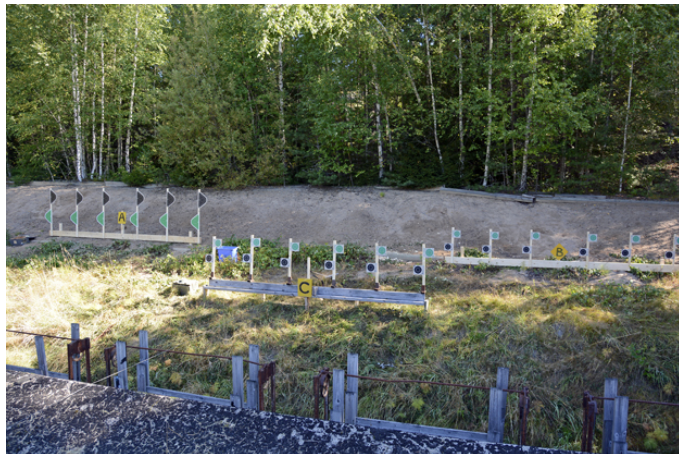
Station 8 på vallen: stå utan, 6 figurer, A + B fast, C uppdykande de sista 4 av 12 sekunder.