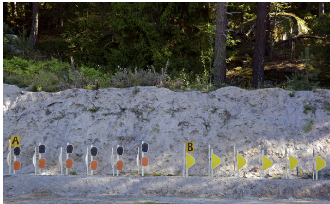
Station 4: stå, A + B framme första 8 sek > C + D framme sista 8 sekunder.