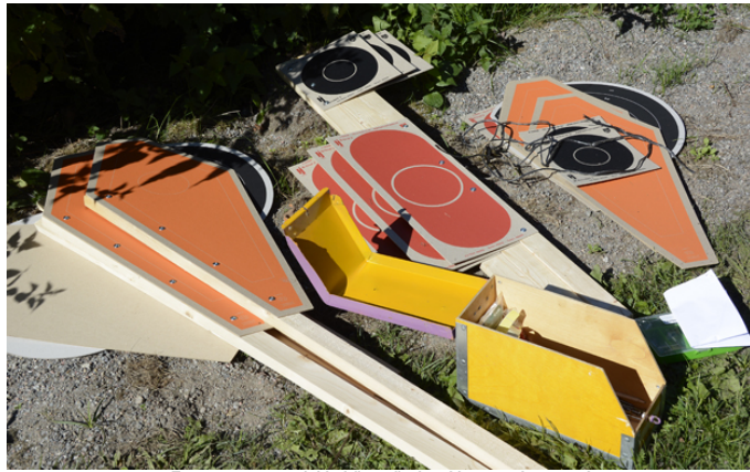
Extra reservmaterial behövs när det skjuts mycket grovt!