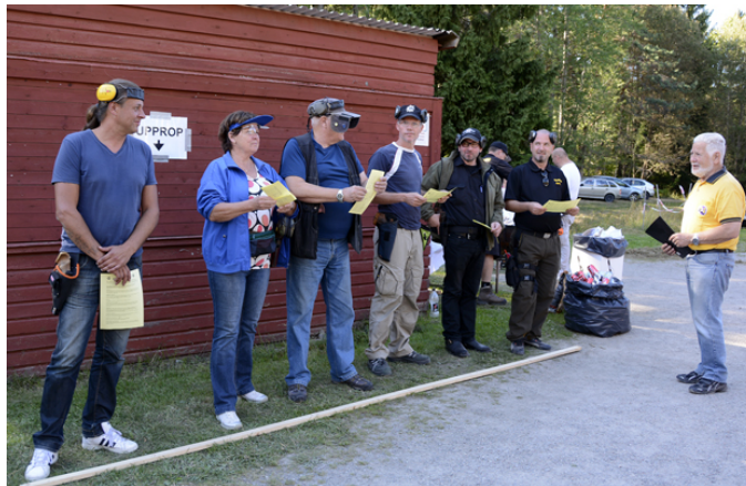
Och ropade upp!