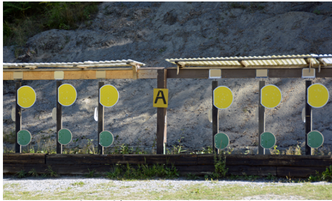
Station 6: Stående - direktväxlande, 3 + 4 + 3 sekunder.