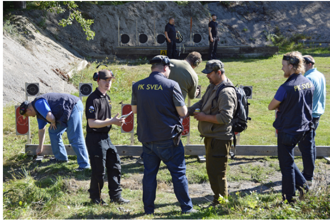
Station 7: 4 figurer, stå utan, A direktväxlande efter 12 sek, B fast i totalt 15 sekunder.