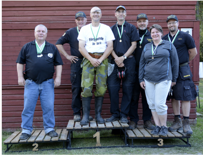
Hela tre (3!) lag från Salems PK på prispallen!