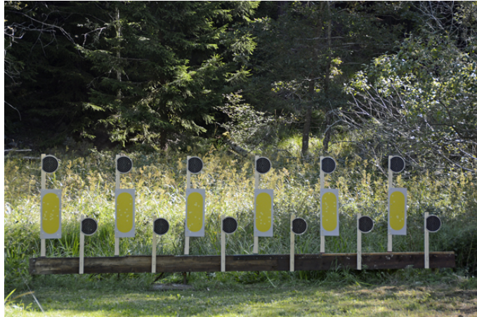
Station 3: knästående 45, A fast, B framme 3 plus 4 av 18 sekunder.