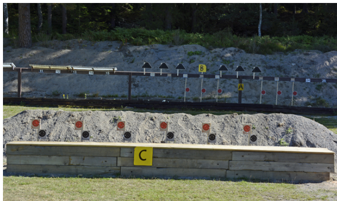
knepigast* - station 5: B + C fast, A framme första & sista 2 av 18 sekunder.