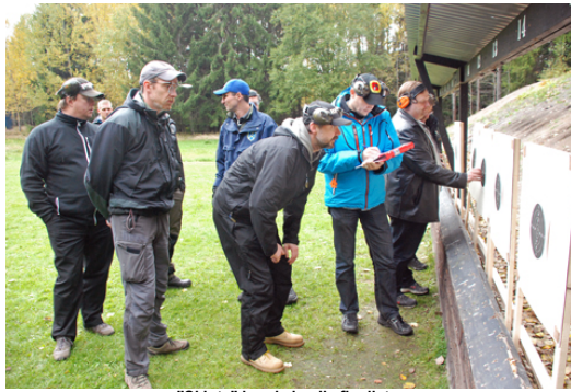
"Skjuta" kunde ju alla finalister, men vem hade de bästa nerverna?