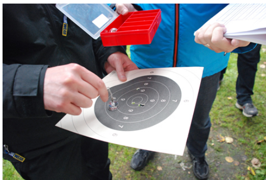
Ibland gick dock "tolkskotten" INTE in!