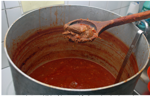
... skyttarna bjöds på kanongod & värmande gulaschsoppa!