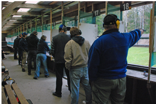
Atta (8!) skyttar gick till "Nya Handen Open" finalen!