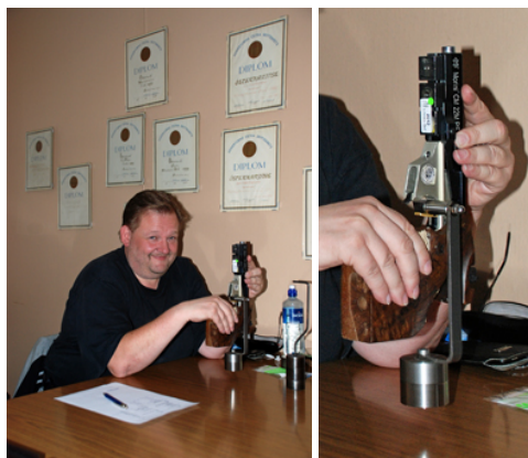
... kollades vapnen och ...