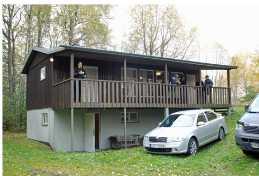
I Handens klubbstuga ...