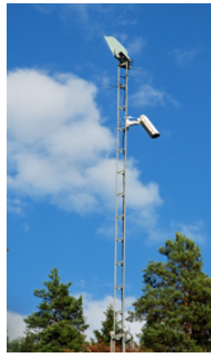
"Alla bommar filmades!"