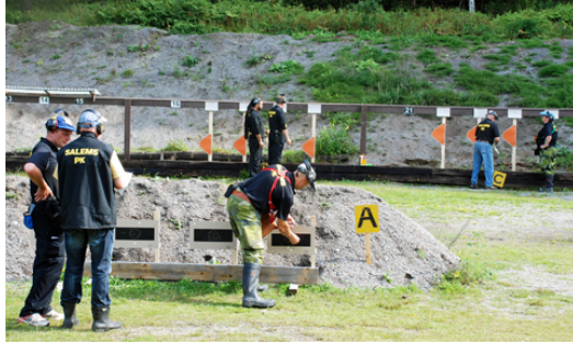
markering på ettan