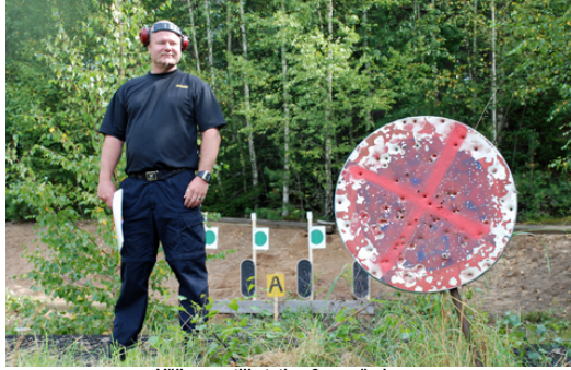
Välkomna till station 6 - gevärsbanan