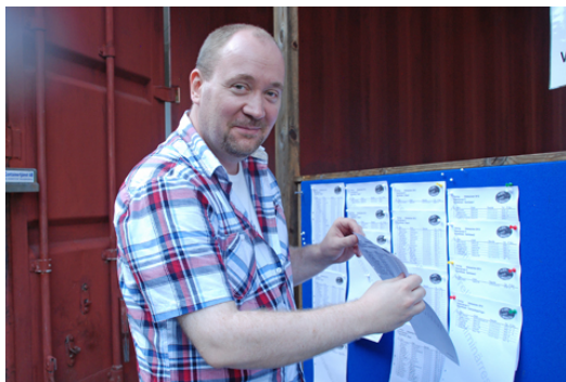
Kontinuerlig och bra resultatredovisning!