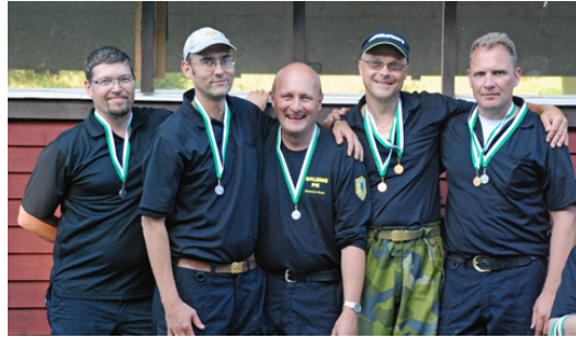
Kretsmästare i lag - Salem lag 2 silver - Salem lag 1 brons - Stockholmspolisens 1 (ej i bild)