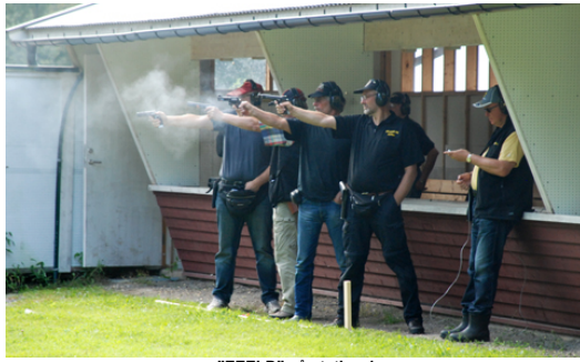
"EELD" på station 1