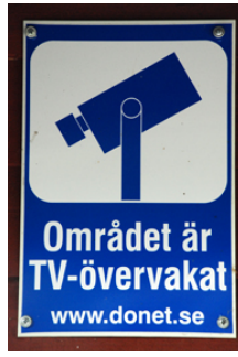
"STOREBROR SER DIG!"