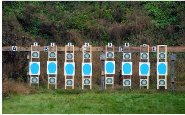
Station 1 - "inskjutningen"