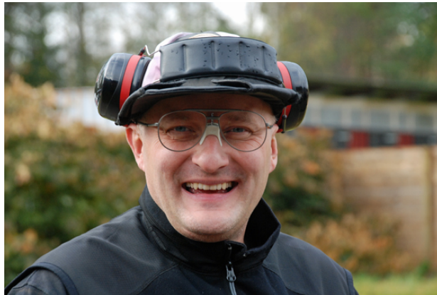
Gissa vem som var bäst i Revolver !?!