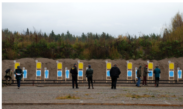
Station 4 - framför B-hallen