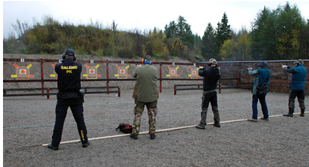
Station 5 med 5 figurer framför B-hallen.