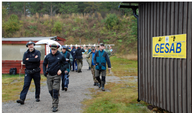
Patrull på väg till station 4. Allt målmaterial köptes av GES AB.