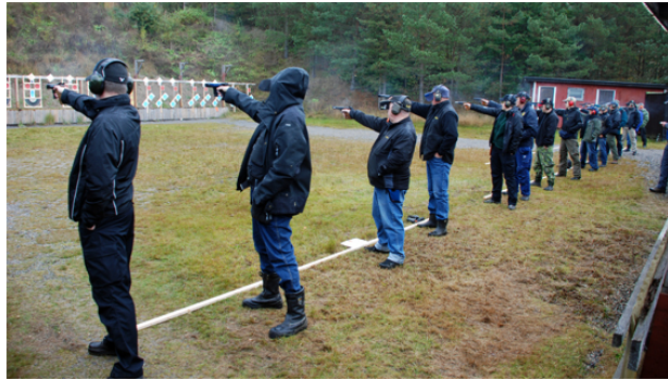
Samordnad skjutning på station 2 och 3.