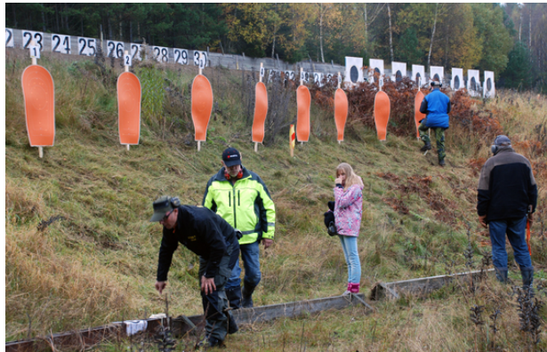
Station 6 - långhåll med 2 figurer på 300 meters vallen - poängräkning i "gevärstavlan".