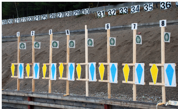
Station 7 > tre visningar > 4 + 3 + 4 sekunder.