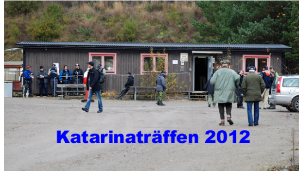
Katarina Psf:s populära Poängfältskjutning - i år i "växlande väderlek"!