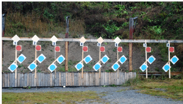
3 figurer på station 3