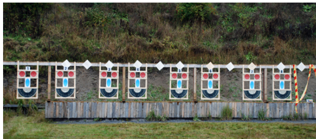
Trots lite regn ibland - bara "leende ansikten" på KATARINATRÄFFEN 2012