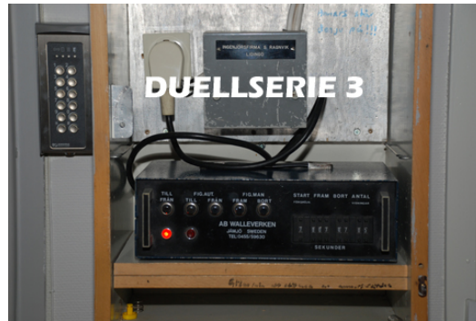
Höga resultat i tredje omgången!

Lycka till även på resten av DUELLSERIEN!