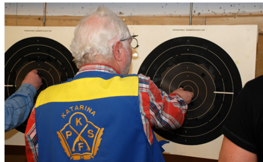
Katarina Psf:s skyttar deltar alltid i Duellserien!