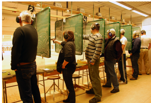
5 gånger PANG i BYGGET å 3 sekunder!