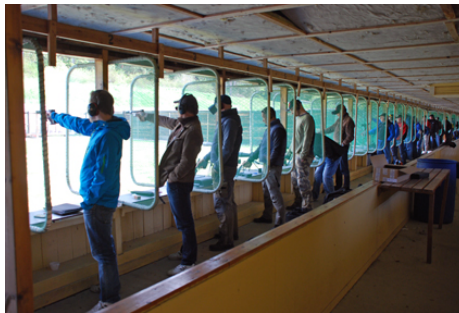
... FÄRDIGA --- ELD!