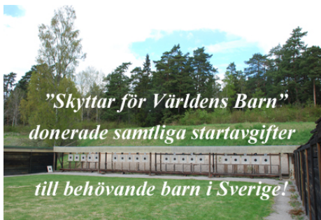
Startavgifterna gick oavkortade till organisationen "MIN STORA DAG".