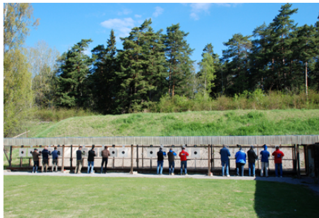
1 MAJ 2011 på Grimsta - soligt, men kyligt!