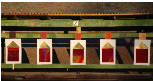
... som bestod av "Nyårsraketer".