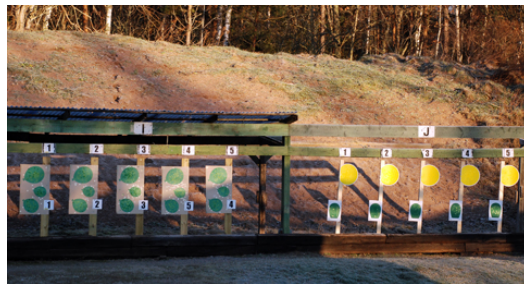
A och B mål på station 5 - poäng i gula figuren.