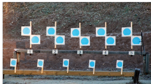
Station 7 - poängräkning i alla!