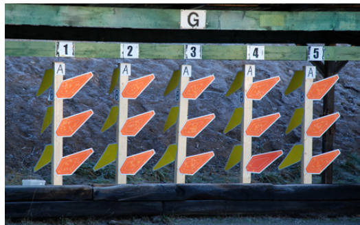
6 direktväxlade figurer på station 4.