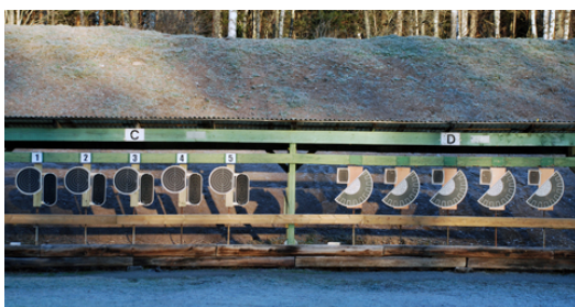
Station 3 - poängräkning i C- och S-mål.