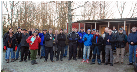
Skaran av entusiasterna som "sköt ut" de gamla året i Upplands Väsby!