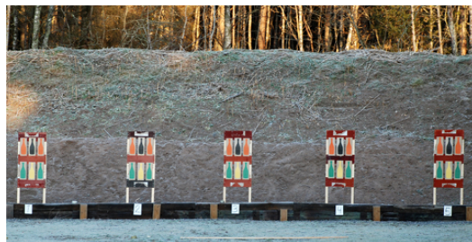
6 flaskor Champagne på station 6! SKÅL & GOTT NYTT ÅR!