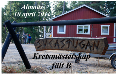
Arrangör - Pk SVEA i Södertälje