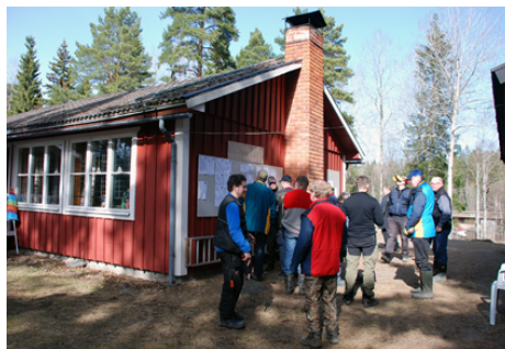
Vid resultatavlan: - Vem vann kretsmesterskapet i år?