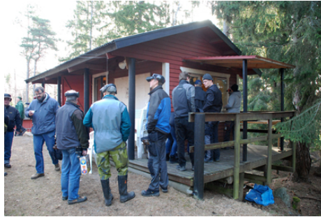
Vapenkontrollen klockan 08:00.