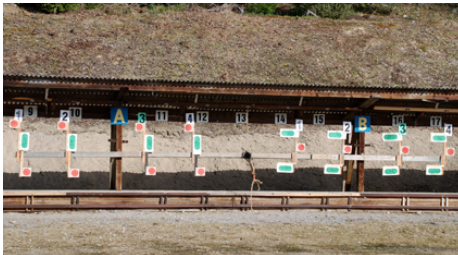
Tuff sarskjutning! Små mål på korta tider!