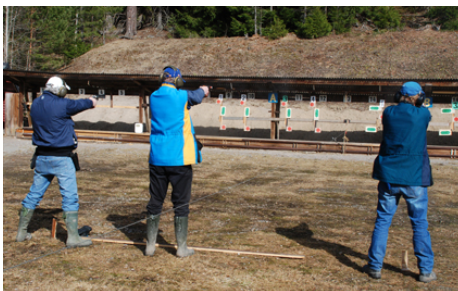
Tre skyttar i kampen om bronsmedaljen.