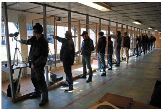
Fullt i stora skjuthallen på 15:e Mälarskottet.