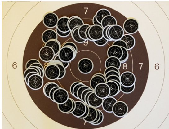
Mälarhöjdens Ps hade förberett sig på många 50-poängare!