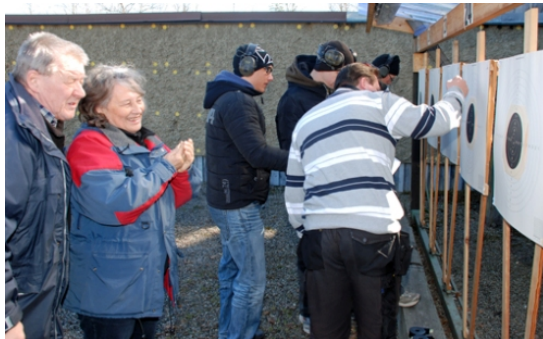
Går den in? Undrade Pk SVEA-skyttarna.