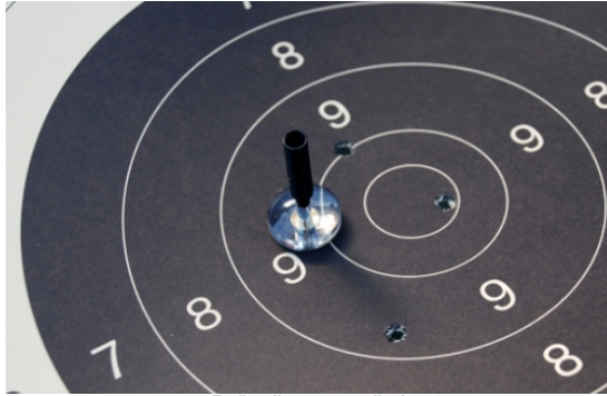
Tyvää - lite svart emellan!