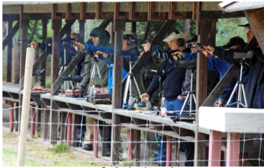
- Det är trångt i toppen!