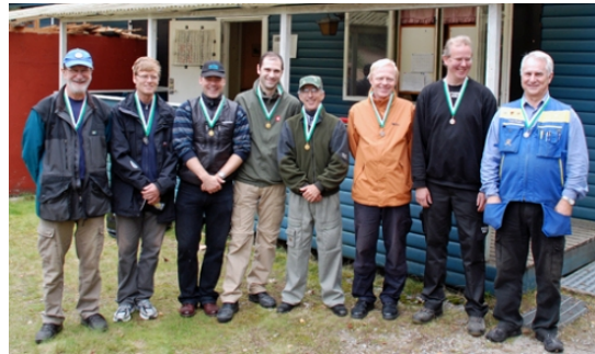
GULD i lag - Atlas Copco Pk silver - Uppl. Väsby brons - Katarina Psf