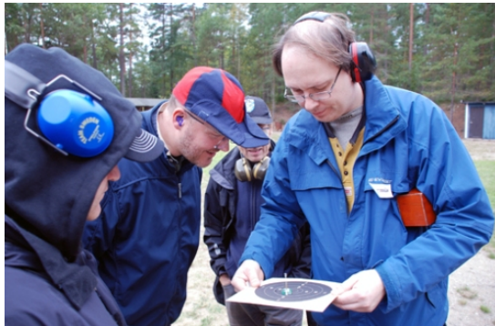
Björns tolkskott gick in!