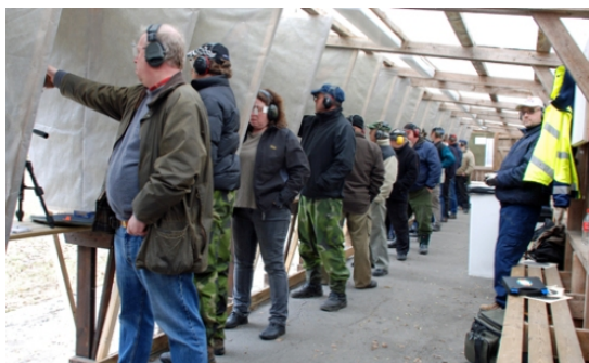
Årets första kretsprecisionstävling ...