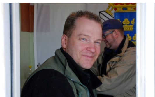
HJÄRTLIGT VÄLKOMNA! Sa tävlingsledaren i luckan.