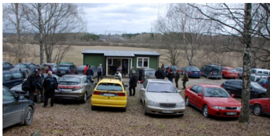
Fullt på parkeringen och i skjuthallen på Håtunaleken 2010.

Lite mer träning och det kanske går bättre för många (inklusive författaren) på nästa precisionstävling MÅLARSKOTTET den 24 april 2010. Lycka till!