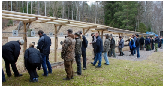
... lite ringrostiga kände sig en del skyttar efter den långa vintern!