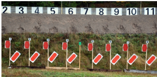
Knepiga snedställda S-mål på station 5