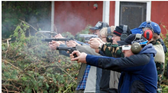
"Jo då! Skjut så det ryker!"