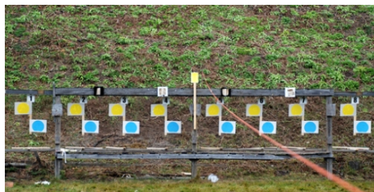
station 2 - Stående utan > |---7---| 6 |---5---| < poängräkning i båda målen