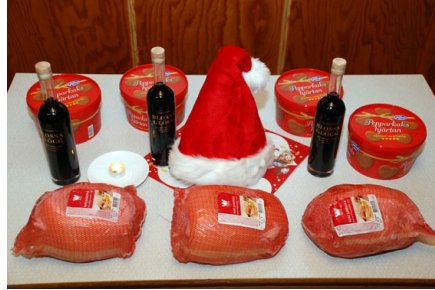
Skinka, glögg och pepparkakor på prisbordet i Rosersberg

Till denna roliga tävling bjöd man generöst in även andra föreningar. Det gällde dock för alla att INTE träffa tomten, för han ska ju komma till oss "oskadd" och med många presenter på julaften.