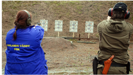
Skjut INTE på tomten!

På sex stationer fanns mål med julmotiv som grisar, äpplen, julgranar och inte minst jultomtar som man dock absolut INTE skulle träffa. Det var dock inte så lätt att undvika "träff i tomten" skulle det visa sig och de därför utdelade minuspoängen kunde dra ner resultaten ganska ordentligt. Att bomma gick ju an, men träffa jultomten kostade 10 minuspoäng!