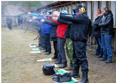
Fullt ös på Faxan!