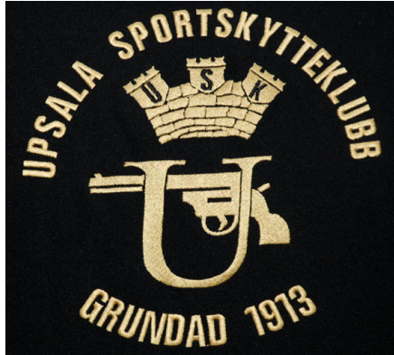
Anrik Sportskytteklubb i Uppsala arrangerade "Vinterfält på Faxan."