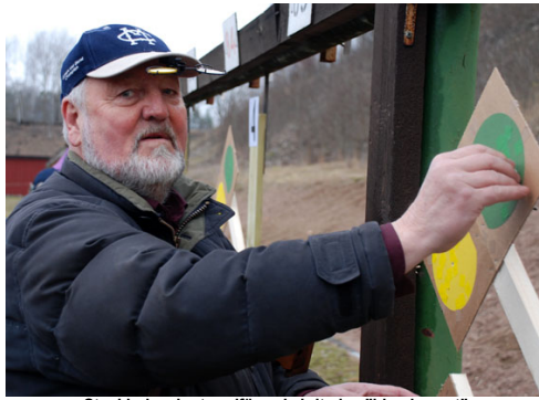
Stockholms kretsordförande kritade - "bland annat"