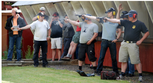
Spännande särskjutning i många omgångar slutade med "sudden death"!