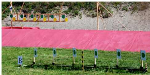
MEN - På station 3 - gungan - "skiljdes agnarna från vetet"!