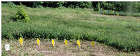
... och neråt på station 7 - långhålet .