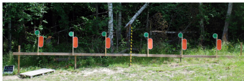
Station 1 - inga problem!