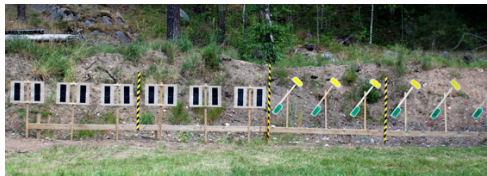
Även station 4 var knepig ...