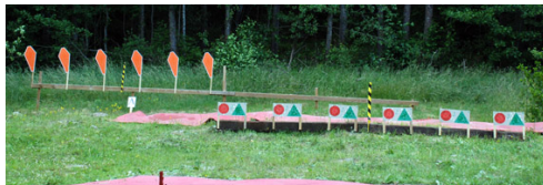
Lagom svårt på station 2