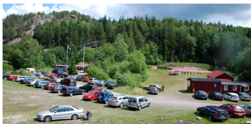
Nytt deltagarekord på Dvardsalträffen 2008 i Åby.