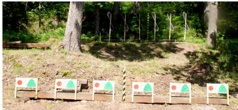
... samt station 5, där "likkistorna" låg helt i skuggan.