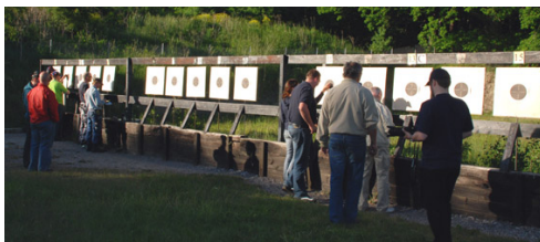
DM i grovpistol - 6 serier precision och 6 serier duell i minst kaliber .32