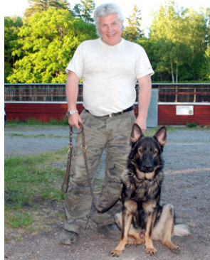
- DM i grovpistol är klar för i år, kan vi åka hem nu, husse?