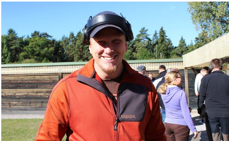
Det gick tydligen bra.