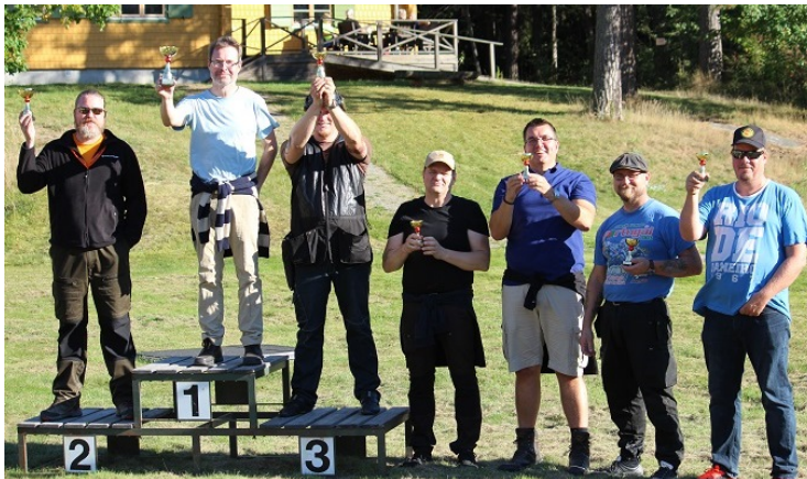
Glada pristagare i fältskjutningen.