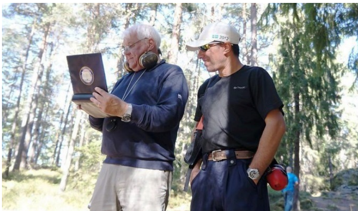
Viktigaste uppgiften i patrullen; kontroll av skrivning!