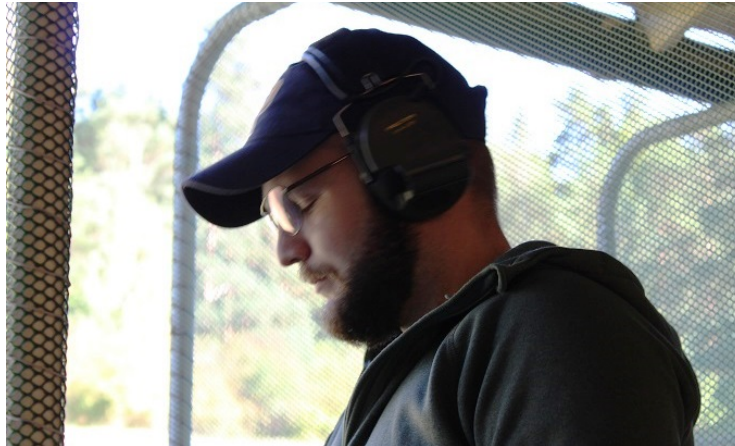
Skyttarna gick in i den mentala bubblan.