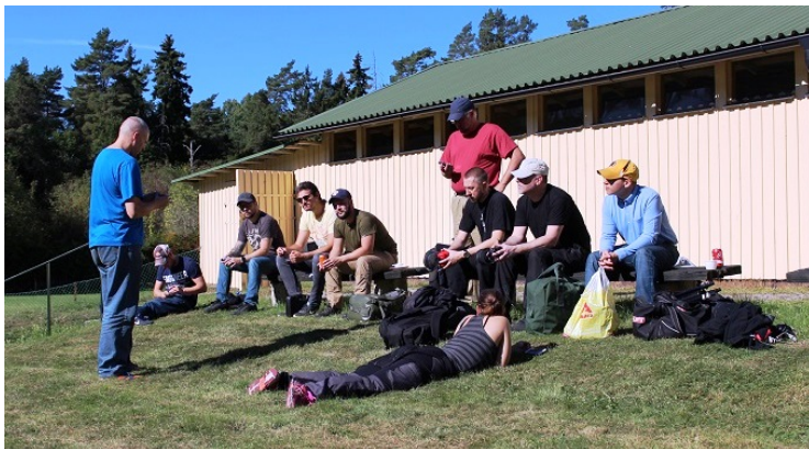
Tips från coachen inför fältrundan.