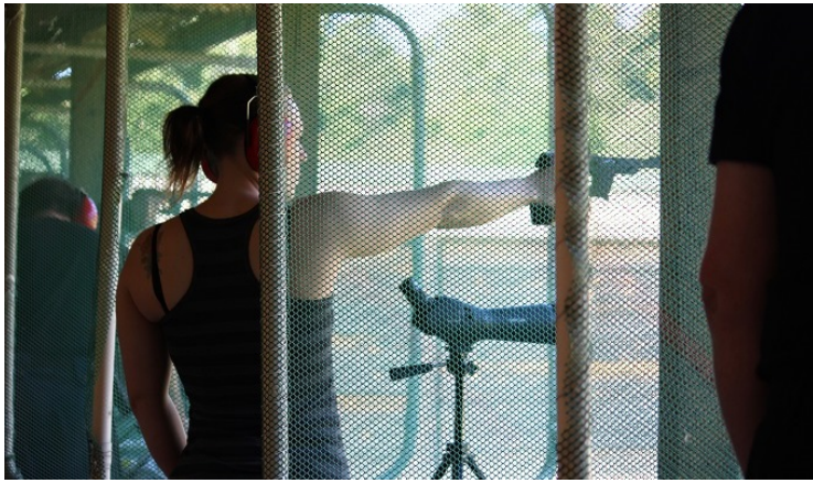
Stadigt, stadigt .....