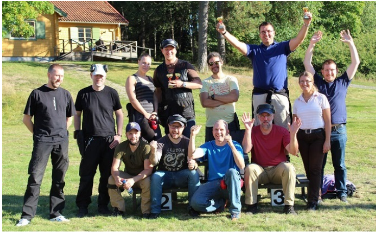
Tjohool Glad deltagarklubb efter en toppendag.