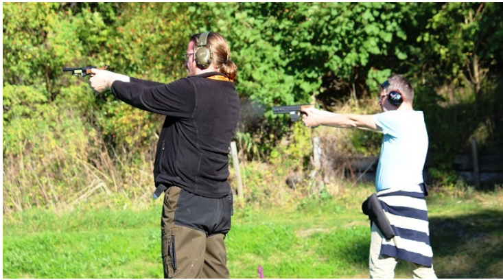
Spännande sarskjutning om förstaplatsen i fältskjutningen.