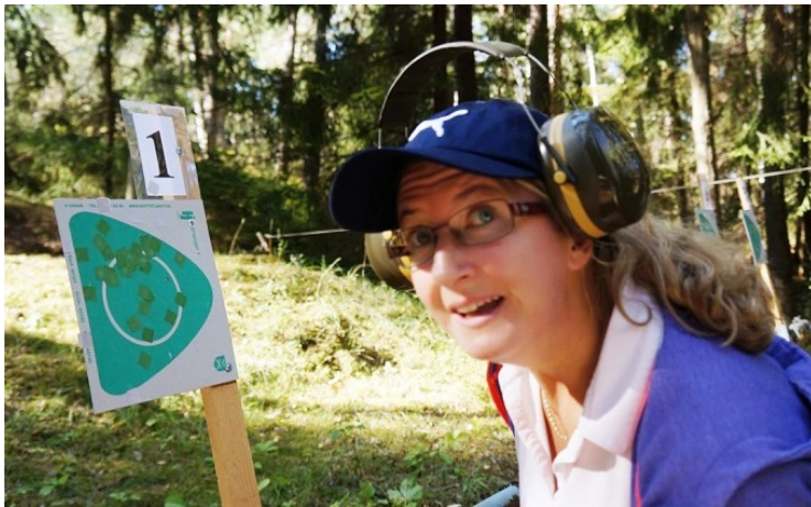
Japp, träff i innercirkeln!