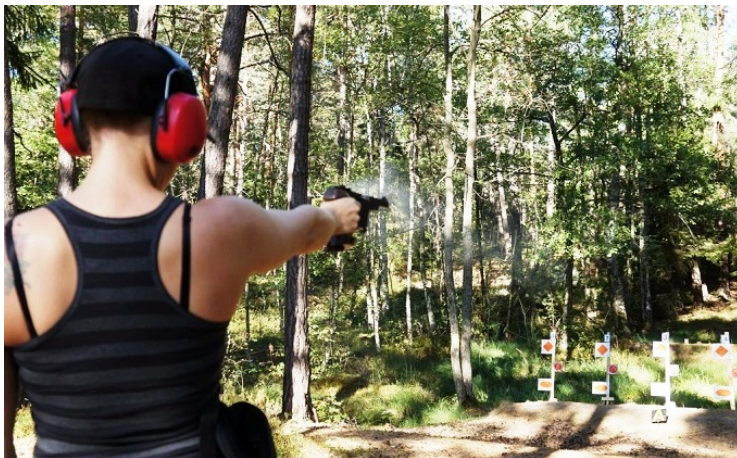
.... sen är det bara att verkställa planen