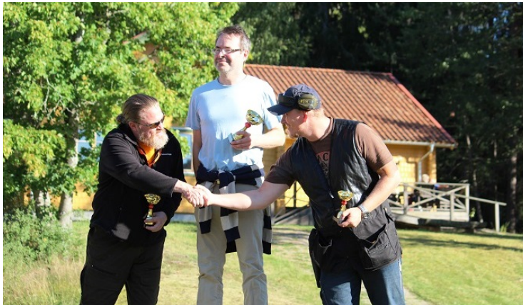
Tack för en god match!