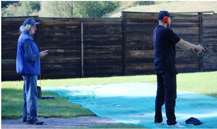
Får man godkänt vapenfel så får man skjuta om.