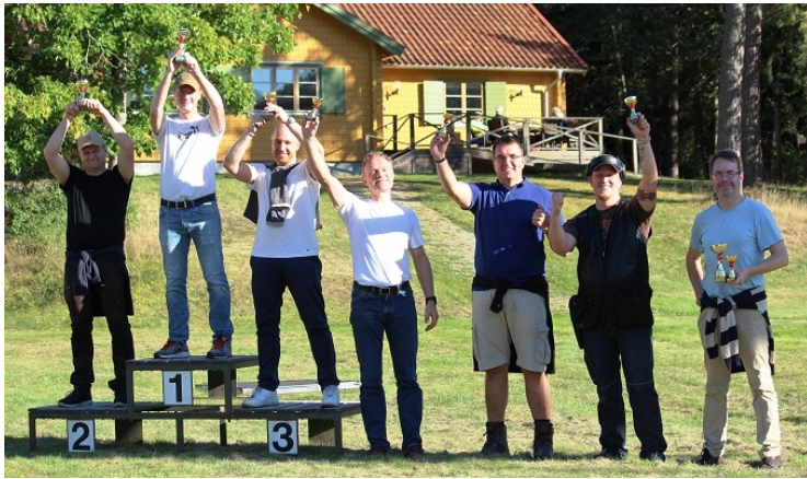
Och lika glada pristagare i precision.