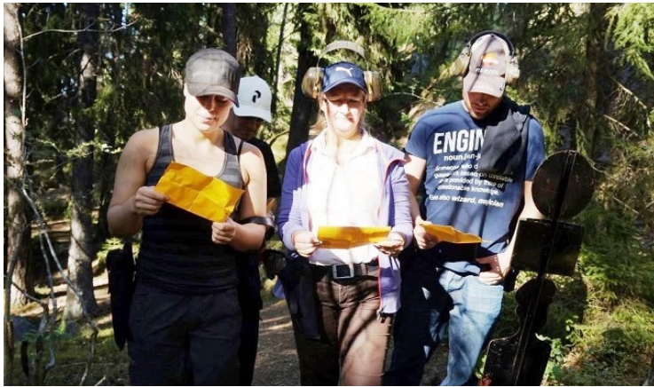
Det gäller att läsa på förutsättningarna mellan stationerna.