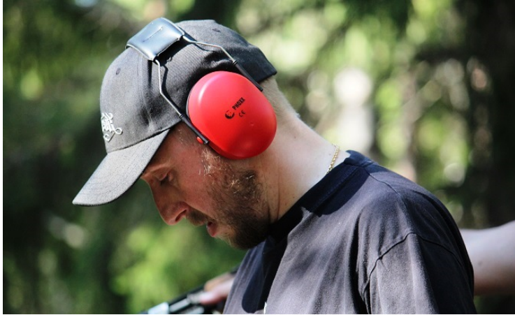
Slappna av, andas, gör en plan för hur du ska skjuta ....