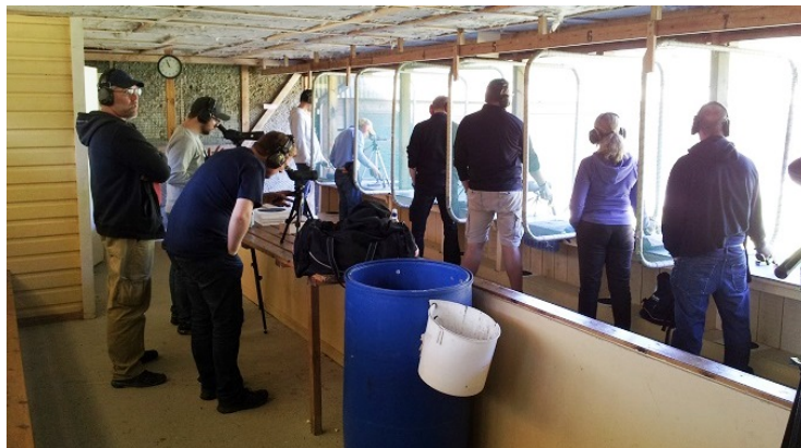
Engagerade faddrar höll full koll.