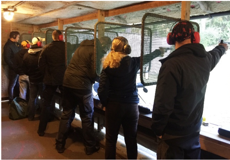
Lovande framtidshopp under tävlingsmomentet