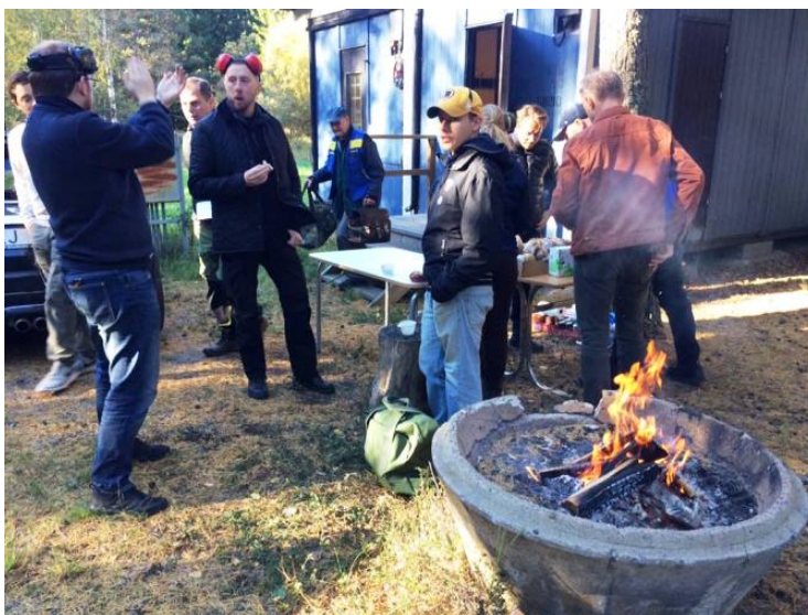
Engagerade faddrar underhåller sina elever med någon form av regndans?

Samtliga deltagare skulle även erhållit den vackra jetong som delas ut varje år, men dessa var enligt uppgift på rymmen någonstans och skall vara skyttarna tillhanda vid ett senare tillfälle.